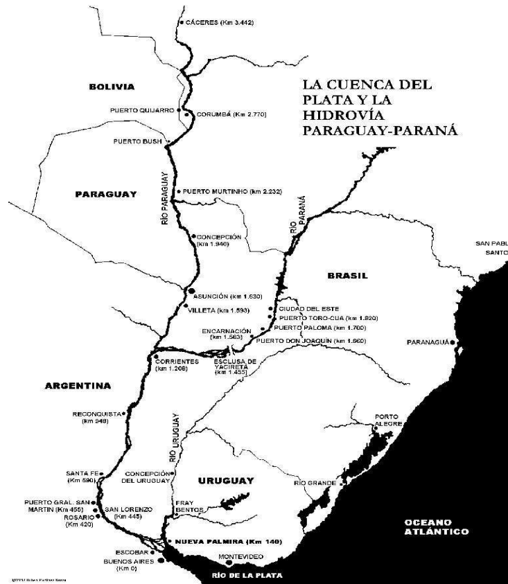
1. ábra: a La Plata medence és a Paraná- Paraguay-alföld vízhálózata