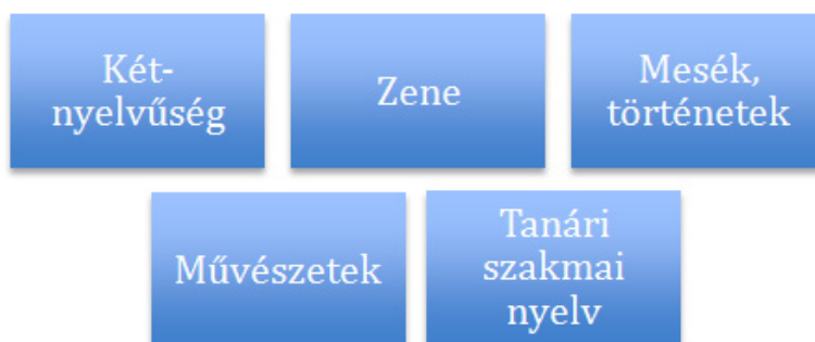
2. ábra: Az első félév témái

A nyelvi előkészítő témaközpontú tematika alapján épül föl. A kétnyelvű általános iskolák tantervének vizsgálata alapján összegyűjtött (környezet, rajz, ének, testnevelés, technika, természetismeret/biológia, földrajz, ITK, országismeret) alapján választottam ki a kurzus témáit, melyek a két félévre lebontva a következők: zene, mesék/történetek, művészetek, természettudományok/környezetismeret, földrajz, matematika és a civilizációhoz kapcsolódóan a történelem. A kurzus bevezető témája a kétnyelvűség lett (2. és 3. ábra).