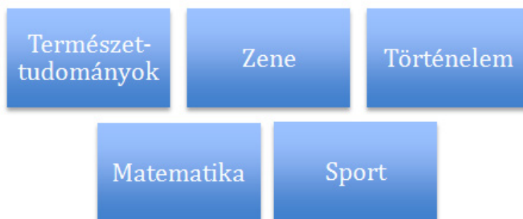
3. ábra: A második félév témái