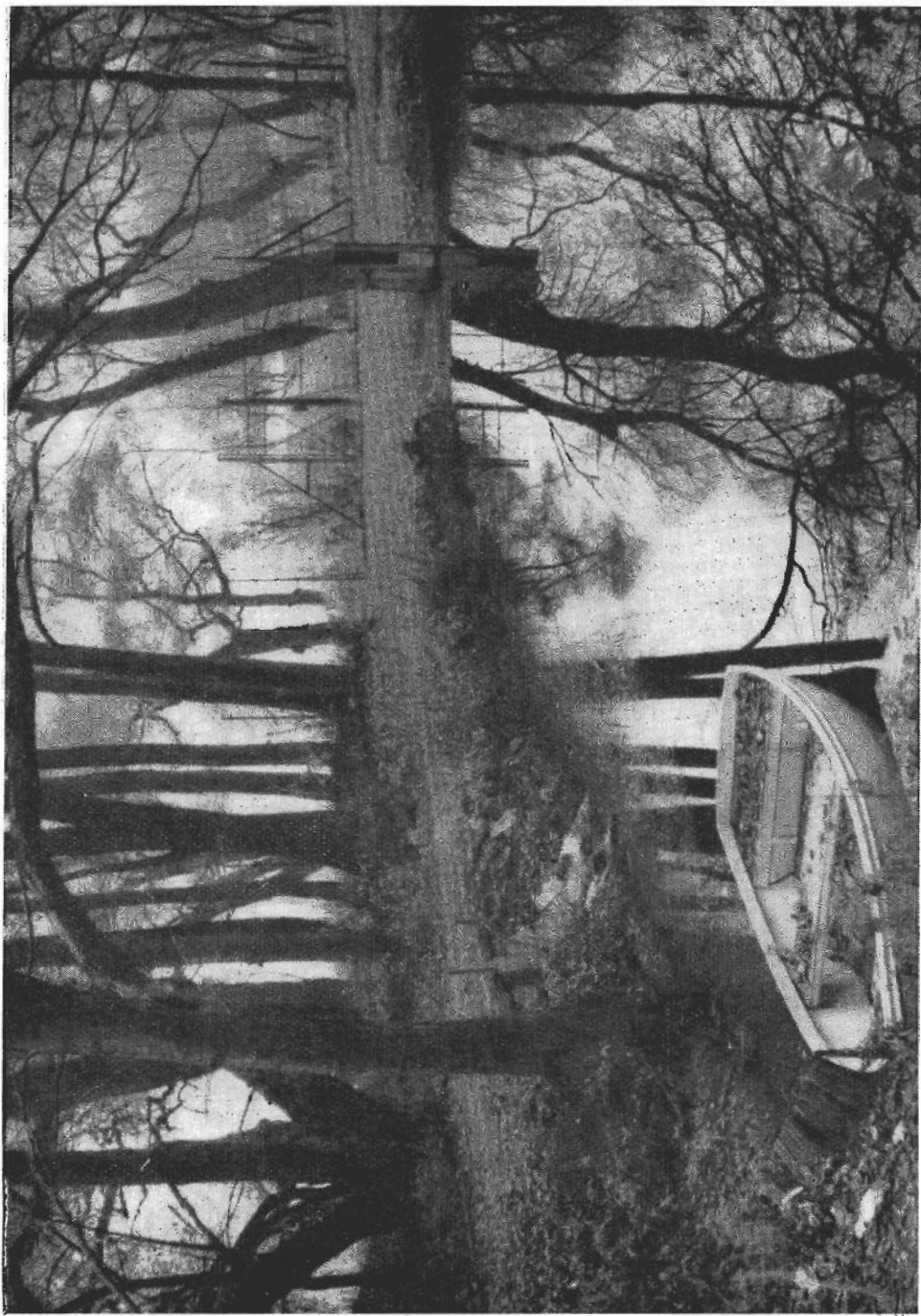
Der untersuchte Teich in Alsógöd