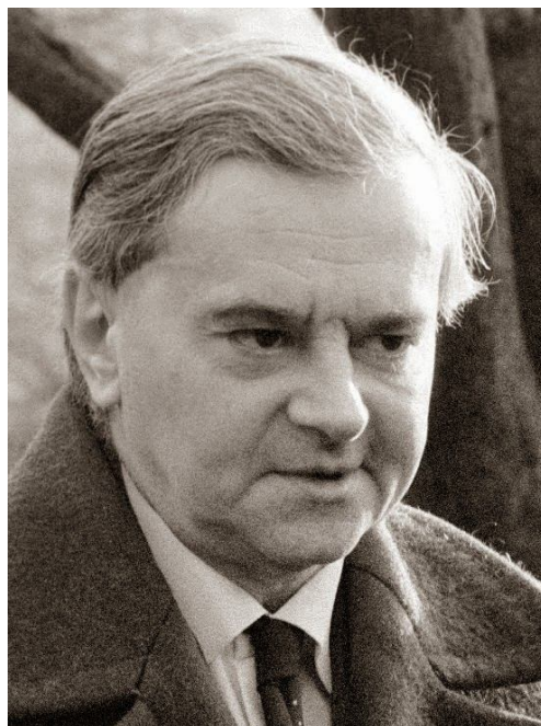
2. ábra Weöres Sándor

A fiatal Weöres Sándor az idős emberekkel kapcsolatos tapasztalatait a harmincas évek Magyarországon szerezte, ahol a hagyományok tisztelete mellett, nyilván jelen vannak a világot átfogó gazdasági recesszió következményei, többek között, az ezen a téren változó, mindinkább a fiatalság fele forduló szemlélet is. Természetesen, ennek a látásmódnak, számos más összetevője is van: a költő gyermekkorában sokat betegeskedik, így aztán korán megismeri a betegségtől és a haláltól való félelmet. Egyedüli gyermek, aki gyakori betegsége miatt nem tud iskolába járni, magántanulóként végzi tanulmányait, így az egyedüllétet és a magányt is megtapasztalja. „Az ablakból néha elnézem őket”, írja az Öregek című versében és kitűnő megfigyelőképességével könnyen felismeri a sorsközösségét az idős emberekkel, empátiával gondol rájuk, hiszen "Oly árvák ők mind..." , írja az Öregek című versében, oly árvák, akárcsak ő. Nem zárhatjuk ki azonban azt sem, hogy Weöres rendelkezett már gyermekként a „cor senile”-vel, azaz az öregkor bölcs szívével, mert erre utalnak az e témában írott korai versei.