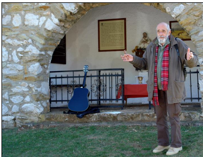
A kápolna létrehozója a 2013. évi Állatok Világnapján tartott ünnepségen