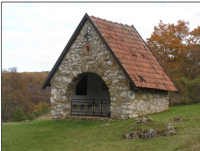
Az Assisi Szent Ferenc kápolna: egykor buszmegálló, ma felszentelt emlékhely