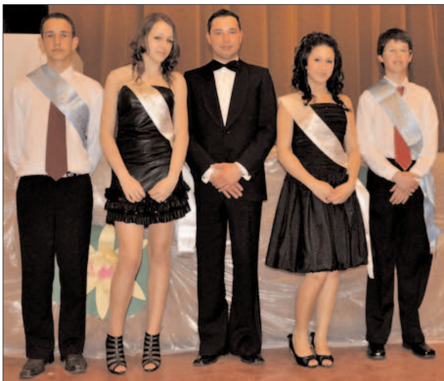
A képen láthatóak: