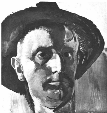
ABA-NOVÁK VILMOS: ÖNARCKÉP

a mai generációk a felületi festőiséget keresik. A tárgyi forma helyett, melyet a fény tett láthatóvá s így a fény által érzékeltettek is a festők, a képforma kezd mint igény fellépni és követeli jogait. E mögött az is van, hogy vizuális fogalmaink a geometriai térformákra, mint sémákra, mintegy közös nevezőjére kerültek. Ma már új képszemléletről lehet beszélni, mely valóságos gyűjtőfogalma a sok-sok izmus által kitermelt kétségtelen atomeredményeknek, ezeket azonban