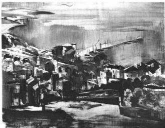
ABA-NOVÁK VILMOS: SAN VITO