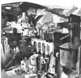
ABA-NOVÁK VILMOS: UMBRIAI VÁROS