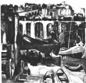
ABA-NOVÁK VILMOS: TENGERPARTI VÁROS. Tempera