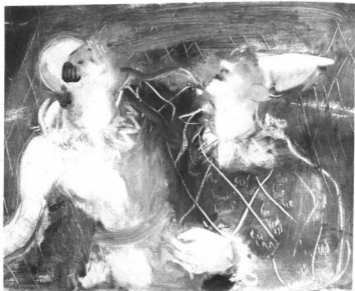
MÁRFFY ÖDÖN: BOHOCOK