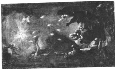
IOSIF MEISTER ISTVAN (1729 körül—1797): A SZENTILEK ELJÖVELE Olajfestés a soproni Szentilek-templom oldalképfelér Orsz. M. Szépművészeti Múzeum A művészei Műismeretek Borsánál Előzetesleírású Irod. Isztár