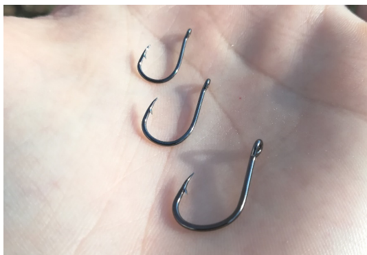
A gyűjtéshez használt hatos, négyes és kettes méretű horgok