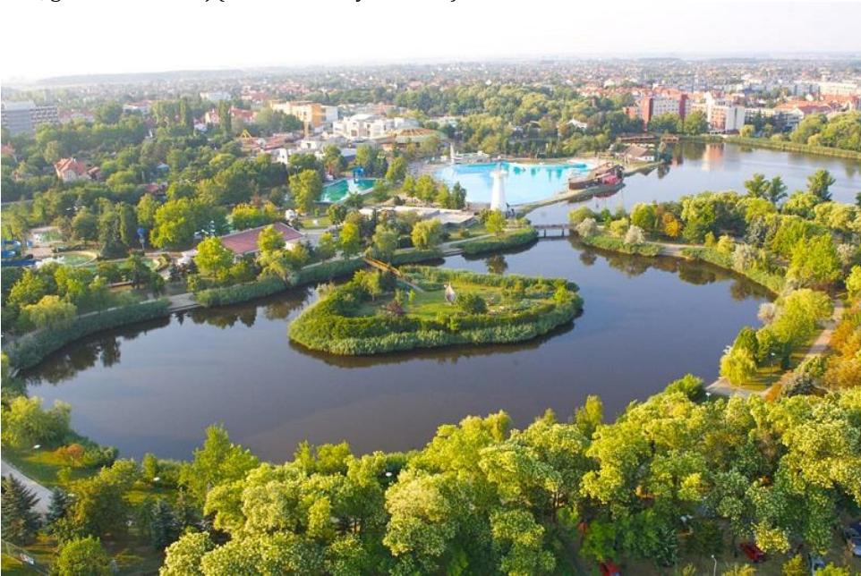
1. ábra. A hajdúszoboszlói termálvizellátással rendelkező csónakázótó Fig.1. The thermal water provided thermal lake of Hajdúszoboszló (URL1)

negatívan az életmenet-sajátosságokra. Ez alapján elmondható, hogy az ezüstkárász a magasabb hőmérsékleteket a pontynál jobban képes tolerálni, ami megegyezik a két faj ökológiai státuszával is, ugyanis az ezüstkárász köztudottan egy tág tűrőképességű, zavarást tűrő, generalista halfaj (Kottelat & Freyhof 2007).