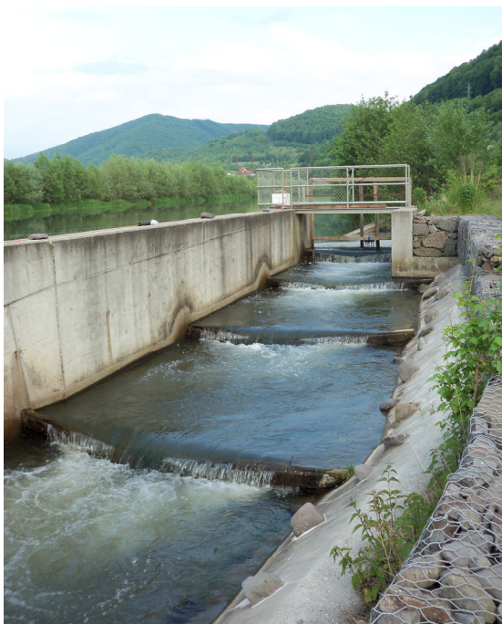
A felsőbesenyői kis vízerőmű hallépcsője