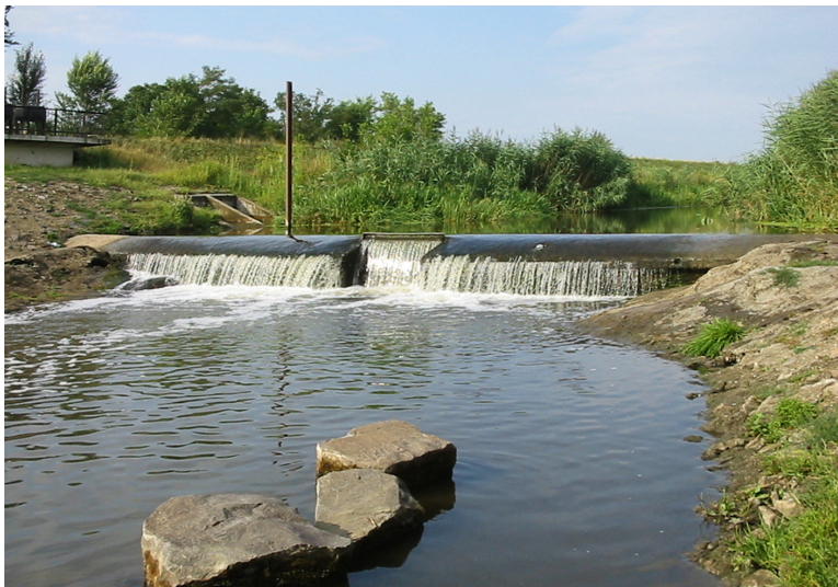
2. ábra. Fenékküszöb a Zagyva jászberényi szakaszán (68 fkm)