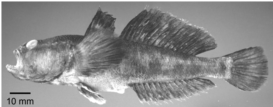
1. ábra. A Duna bajai szakaszán 1997-ben gyűjtött géb Fig. 1. Specimen of gobiid species collected in the Danube at Baja in 1997

A Duna bajai szakaszán gyűjtött géb (1. ábra) morfológiai paraméterei (Guti 1999) alapján egyértelműen megállapítható, hogy a hal a Neogobius és a Ponticola génuszok fajaihoz hasonló megjelenésű, és semmiképpen sem lehet Proterorhinus , amelynek első orrlyukai rövid csövecskéket képeznek.