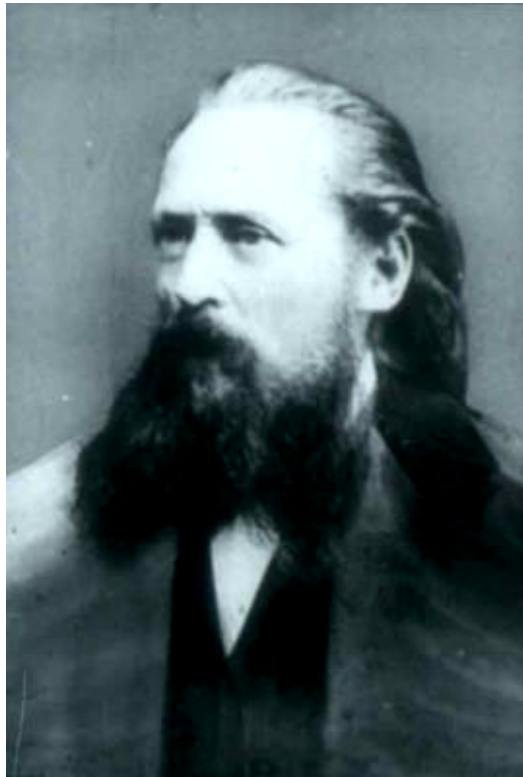
HERMAN Ottó – Ottó Herman (1835–1914)