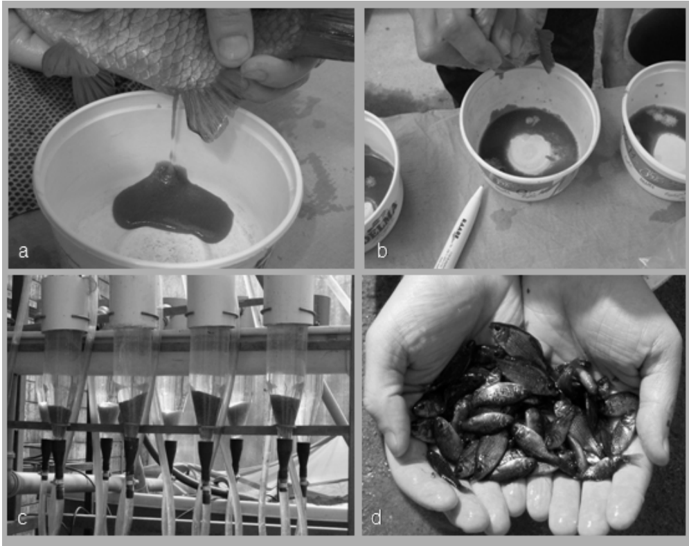
1. ábra. a: ikraféjés, b: a sperma ráféjése, c: Zuger-üveges ikrainkubáció, d: lehalászáskori (161 napos) ivadékok Fig. 1. a - egg stripping, b - sperm stripping on the eggs, c - egg incubation in Zuger jars, d - harvest of juveniles (161-days-old juveniles)

oxigéntartalmat, azonban ez már nem okozott elhullást. A nevelés során nem védekeztünk a tóba bekerülő ragadozó rovarok ellen. A legjelentősebb károkat a hátónúszó poloska ( Notonecta glauca ) okozhatta – próbafogásokkor, illetve lehalászáskor hozzávetőlegesen 100 példány került a hálóba. Emellett a szegélyes csíkbogár ( Dytiscus marginalis ), és különböző csíborfajok lárváit ( Hydrophilidae ) találtuk meg. Ennek ellenére az augusztus 21-i lehalászáskor közel 1600 db 2-5 cm-es egyedeket fogtunk (átlagos nagyságuk 2,6 cm és 0,57 g). Közülük 1100 egyedet a Bátonyterenye-Maconkai Szabadidő- és Sporthorgász Egyesület nevelő tavába telepítettünk. Az 500 továbbtartott egyed táplálékkiegészítésként kétnaponta élő vagy fagyasztott szúnyoglárvát kapott, így a szeptember 11-i próbafogáskor 2,5 – 6 cm-es testhosszt ért el (átlagos nagyság 3,2 – 3,6 cm és 1-1,3 g; 1/d ábra).