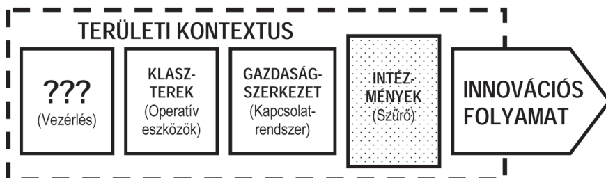
3. ábra: A vezérlés mint a területi innovációs rendszer hiányzó eleme Control as the missing function of the regional innovation system

Ebben a tanulmányban nem foglalkozom részletesen a klaszterorientált fejlesztéspolitika kérdéseivel; ezeket mások rendkívüli részletességben és mélységben tárgyalták (Asheim, Cooke, Martin 2006; Lengyel 2010; Lengyel, Rechnitzer 2004 stb.); csak egy, a vizsgált téma kapcsán releváns szempontot érintek. Van den Berg, Braun és van Winden (2001) hívta fel a figyelmet a klaszteréletciklusok és az agglomerációs folyamatok összefüggéseire, 3 kiemelve hogy a kifejlett, érett klaszterek számottevő előnyökkel rendelkeznek, többek között a skálahatásoknak köszönhetően (a marshallihoz hasonló) agglomerációs externáliákat élvez-