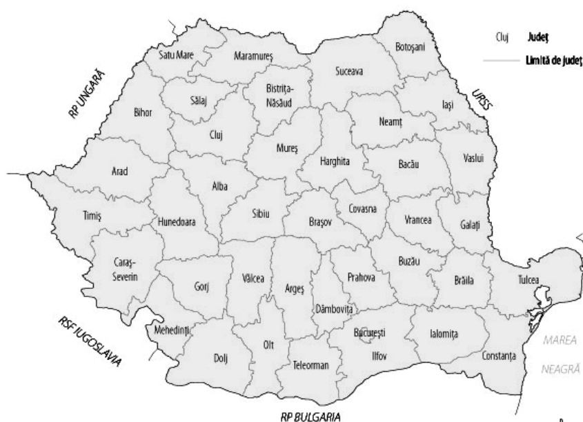
5. ÁBRA A megyék reformja 1968 (Reform of Counties 1968)