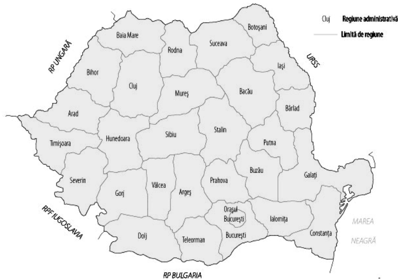
Románia tartományai 1950–1952 (Province-system in Romania 1950–1952)