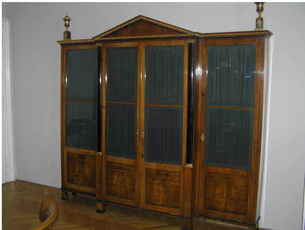
1. kép. Az Iparművészeti Múzeumban őrzött könyvszekrény

1918-ban közreadott följegyzéseiben Thomas Mann a német viszonyokra tekintve úgy fogalmaz, hogy 1870-et követően „a német polgár kapitalista-imperialista burzsoává fejlődött, de nem is, hirtelen, mintegy Kírké varázspálcájának hatására azzá változott, elvesztette emberiségét és lelkeségét, burzsoává keményedett. A kemény polgár: ez a burzsoá. A szellemi polgár nincs többé.” Hogy mi is az, aminek elvesztésén kesereg, már előbb megfogalmazta: „A német polgáriasság, ez mindig német emberiség, szabadság és műveltség volt. A német polgár tulajdonképpen a német ember volt, [...]”, sőt: „Az a tény, amelyből kiindultunk, [...] az artisztikum és a polgáriasság keveredése Németországban legitim szellemi életforma, [...]”. A Buddenbrook ház