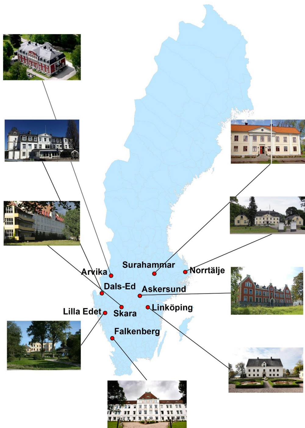
1. ábra: A flyktingslottal rendelkező svéd kommunák (2019, szerzők szerkesztése. A képek elérhetősége az internetes források után található)

Az adatok gyűjtését megkönnyítette, hogy Észak- és Nyugat-Európában egyre elterjedtebb a regiszter alapú népszámlálás, miszerint minden polgár rendelkezik egy személyi számmal, mely tartalmazza az egyén alapadatait. Ezt egészítik ki azok a bevételek, amelyeket az oktatási intézmények, munkahelyek és a személyek kötelesek benyújtani az állam felé (Lakatos M.–Sánta J. 2001). Ezért a svédországi adatbázis sokkal naprakészebb és megbízhatóbb. A Svéd Statisztikai