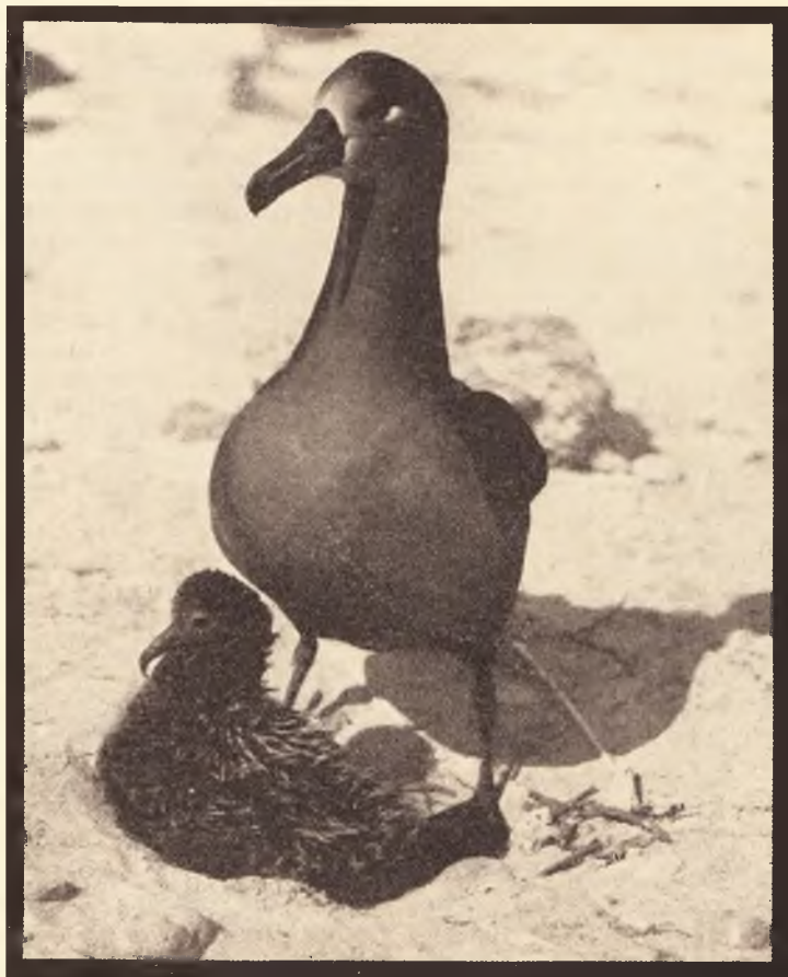
A feketelábú albatrosz fiókájával.

Eleségszerzéssel s röptellessel telik el az albatroszok napja. Olyan, mintha nyugalomra nem is lenne