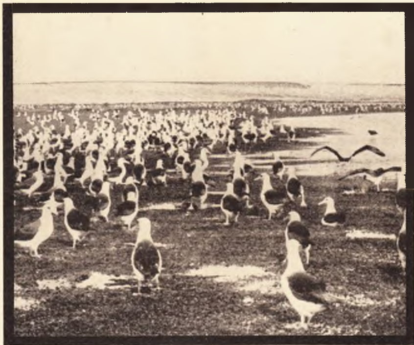
Fészkelő albatroszok telepe a tengerpartmenti szigeten.

Táplálékot szerezni csak csöndes időben tud. Viharban nagyon megéhezik s különösen ilyenkor szokta