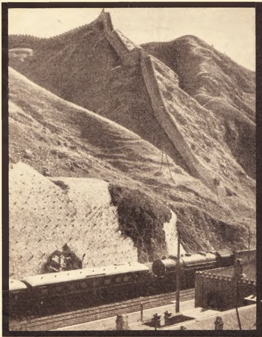
Modern kínai gyorsvonat a Nagyfal tövében lévő egyik állomáson.

ELŐFIZETÉSI DÍJA: 1 ÉVRE 6 P, FÉL ÉVRE 3 PENGŐ. — 1 SZÁM ÁRA 12 FILLÉR.