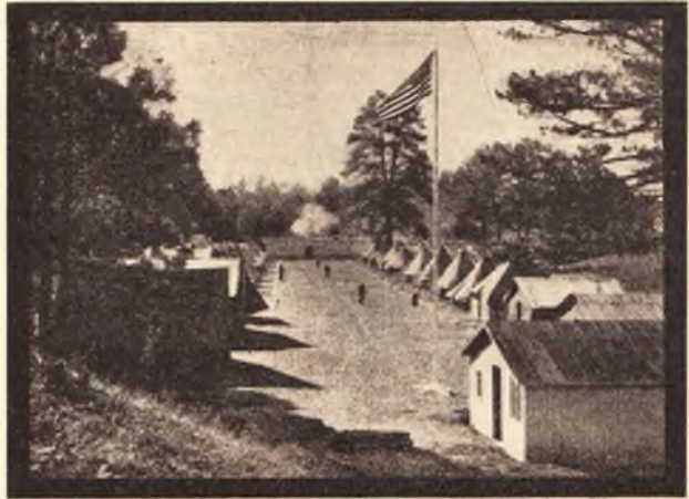
A munkahadsereg egyik tábora az erdőben.

háború alakjában folytatják. Az eszeveszett, kegyetlen és tarthatatlan békediktátumok állandóan új háborúk rémével fenyegetnek s a nemzetek az új háborúk lehetőségére számítva s e miatt aranyukat féltve, mind csak eladni akarnak, vásárolni nem. Ezzel szétépték a világkereskedelem nagyszerűen kiépített, hatalmas szervezetét, amely lehetővé tette a munkás nemzetek boldogulását, fejlődését. A nemzetek önellátásra, a világkereskedelemből való kikapcsolódásra rendezkednek be, ami az első pillanatra képtelenségnek látszik, alapjában véve azonban szükséges következménye a gyűlöletté fokozódott általános bizalmatlanságnak.