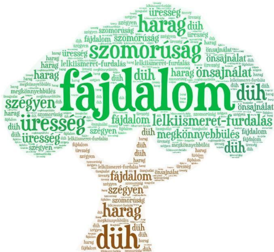
1. ábra Szófelhő a gyászhoz kapcsolódó érzések sokféleségéről