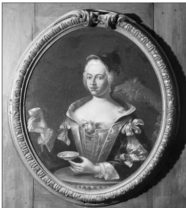
5. kép. Mesko Éva arcképe a Zichy-Mesko palota porcelánkabinetjében. Louis van Roÿ, 1740.

tokot szerzett családja ősi földjén, az északkelet-magyarországi megyékben, Mesko Ádám kevesebb és kisebb birtokkal bírt, viszont több adat szól jelentős kölcsönügyleteiről, s néhány az így megszerzett tekintélyes pénzvagyonáról. 34