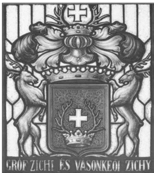
8. kép. A Zichy grófok címere

vármegye Fő téri házának gondolatát megérlelték: a Fő téri megyeháza építése 1829-ben vette kezdetét.