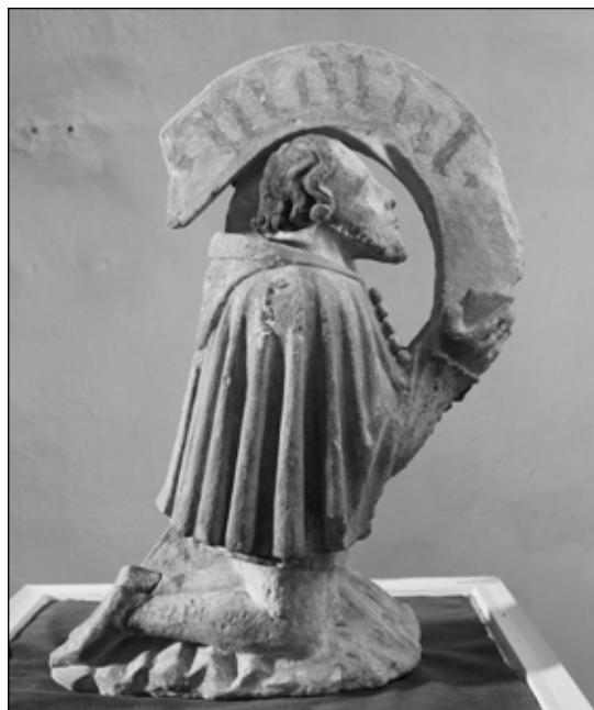
1. kép. A ferences templom donátorának szobra a káptalantermi kiállításban. Nagyboldogasszony (Bencés) Templom.

Sopron házainak első rendszeres összeírásában (1379), amelynek célját és rendszerét Mollay Károly rekonstruálta 3 a Kolostor utcán, a közel 28 méter homlokzathosszúságú épület „ Hayreich gayzzel II hausse ” megjelöléssel szerepel. Az összeírásban szereplő „ haus ”-nak nevezett egységet magam interpretáltam olyan hossz méretként, amely a telkek homlokzatának hosszát fejezi ki, s 15 méter körüli. 4 A Kolostor utcai ház azonosítását – a „ haus ” méretének 14 méter körüli meghatározása mellett – Holl Imre végezte el. 5