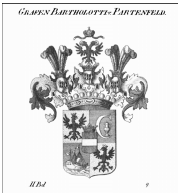
6. kép. A Bartolotti von Partenfeld grófok címere