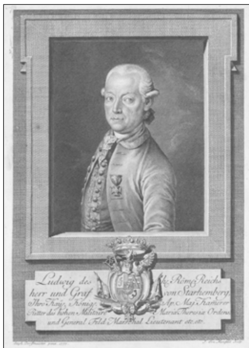
7. kép. Ludwig Adam Starhemberg gróf arcképe. J. Mansfeld metszete Dorfmaister arcképe után.

is megjelent. 46 Hét évvel később, 1772-ben Mesko Éva elhunyt. A hátrahagyott férj, J. L. Starhemberg természetesen kiköltözött a Mesko palotából, de nem ment messzire: megvásárolta a Kolostor u. 3. – Új u. 4. sz. házat, felújíttatta, igen szép homlokzatokat alakíttatott ki a ház mindkét oldalán, a kapukat pedig nemzetsége kőbefaragott címerével díszíttette.