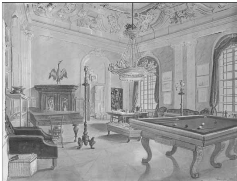
9. kép. Steinacker Károly: A Zichy-Mesko palota díszterme, 1853. Soproni Múzeum, Képzőművészeti Gyűjtemény

gorával, kényelmes bőrfotellettel, pamlaggal és sok különféle berendezési tárggyal, amelyeket nem feszes rendben, hanem barátságos oldottsággal helyeztek el itt. A falak dísztelenek, színük zöld – ezt a színt a biedermeier idején nagyon kedvelték – csak a gazdagon festett mennyezetet alátámasztó fehér falpillérek emelik a terem megjelenését. A most folyó föltárások azt mutatják, hogy a díszterem falait a zöld egyszínű festés elkészítése előtt alaposan átdolgozták (hogy vakoltak is, vagy csak lekapartak, az még kiderítendő). A Steinacker festette látvány azóta szinte változatlan, mert a nagytermet e festmény készítése után csak rövid ideig használhatták. Érdeemes megjegyezni, hogy Steinacker ábrázolta a nagyterem barokk stílusú csillárját, amelyről az 1816. évi kontraktusban esett szó, s amelynek aranyozott fa-koronája lappang ugyan, de függesztőpálcája ma is megvan.