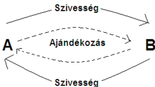
1. ábra. A guanxi működésének modellje

A guanxi kapcsolatra nem jellemző a felek egyenjogú felfogása, az ugyanis alapvetően hierarchikus. A hierarchiában elfoglalt helyet az egyén arca ( mianzi ) határozza meg. Az arc kultúrspecifikus fogalom (Tsang 1998, 66), amely megközelítőleg a társadalmi státusz és a cselekvési szabadság fogalmakkal ragadható meg. Minél nagyobb arccal rendelkezik az egyén, annál jelentősebb a társadalmi megbecsültsége és az egyéni autonómiája. Az arc forrásai a konfucianus erények, az életkor, a betöltött hivatal, a vagyon, a guanxi kapcsolatok száma és minősége stb. (Littlefield 2001, 200–205). A guanxi kapcsolatban a nagyobb arccal rendelkező fél egy családfőhöz hasonlóan több joggal, de több kötelezettséggel is rendelkezik, mert gondoskodnia kell a gyengébb félről (mint apa a fiáról). A gyengébbnek követnie kell az erőset, nem áll jogában ellenkezni. A lázadás a guanxi kapcsolat felbomlását és arcvesztést jelent mindkét fél számára.