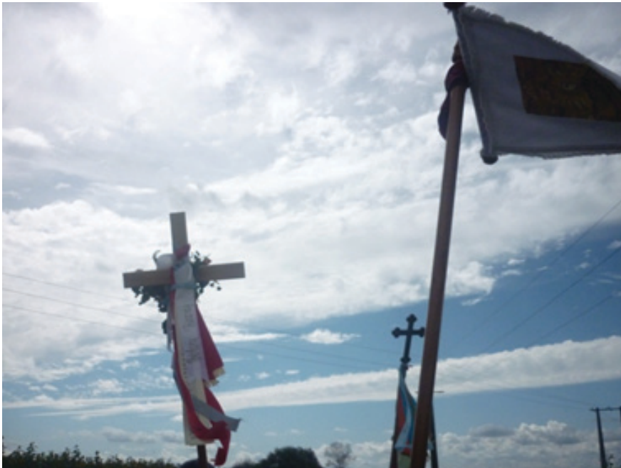
3. A zarándokmenet élén haladó csapat által vitt lobogó és kereszt

Szamoskér és Szamosszeg között érdekes dolog történt. A piros csapat tagja voltam, aznap mi haladtunk a menet élén. Püspök atya Szamoskérig gyalogolt velünk, aztán előre ment autóval. Egy köves, de mellékúton haladtunk, a csapat papja épp távol volt, a kispapok jöttek elől velünk. Épp hazai retró számokat énekeltünk. Mint már korábban említettem, ez úgy működik, hogy bárki énekelhet a mikrofonba, ha van rá affinitása. A következő szám a Limbó hintó volt. A 3. képen látható zászlókat és keresztet vittük. Az egyik fiú felvetette az ötletet, hogy limbózzunk a kereszttel. Érdekes pillanat volt. Az a pár másodperc, a habozás, a vacilálás ideje. Az egyik kispap javasolta, hogy ne a keresztet, csak a zászlót használjuk. Nagyon jó volt a hangulat, sokan átbújtak a zászló alatt. Én nem tettem. Napokig gondolkodtam azon, hogy miért nem.