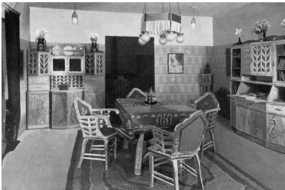
2. A Műhely kiállítása. Ebédlő. Készült a Kassai Kir. Javítóintézetben