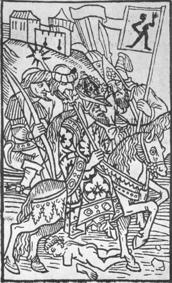
„Die Ordnung zu Ofen“ strassburgi kiadásának címlapja