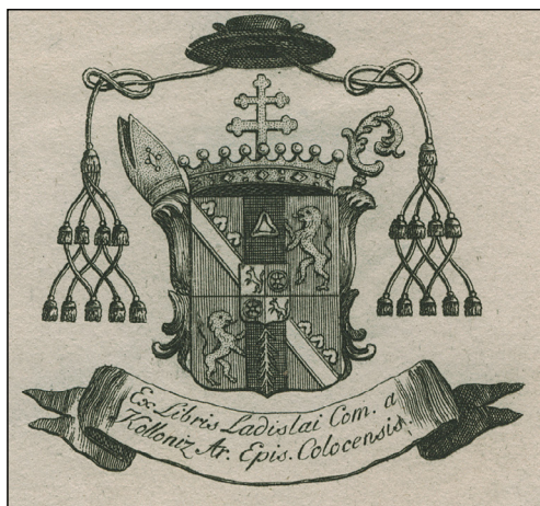
Kollonitz László kalocsai érsek ex librise

Széchenyi Ferenc gróf (1754–1820) főispán, királyi kamarás, a Magyar Nemzeti Múzeum és az Országos Széchényi Könyvtár alapítója cenki könyvtára számára többféle ex librist is készíttetett, melyek közül kettő felirat nélküli, a családi címerüket idézi, kétféle címerpajzzsal. Legelterjedtebb a harmadik, rézmetszetű könyvjegy, mely megfelelt a kor romantikus ízlésének. Ezen a címerpajzs már csak kiegészítő, díszítő elemként jelenik meg, romos tájban kardját lecsatoló római veteránt ábrázol, a tulajdonosra utaló felirattal: „Ex Bibl. / Com. Franc. / Széchényi”. Metszője: Junker Keresztély, 1786 körül. Az 1903-as tárlaton ez utóbbi volt kiállítva.