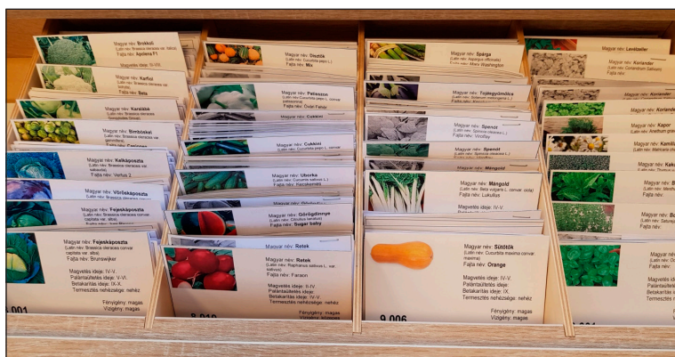
A katalóguskártya a magokkal együtt hazavihető

Könyvtárunk 2019 őszén indította el magkönyvtári szolgáltatását, mely kezdetektől nagy népszerűségnek örvend. Elsődleges célja a helyi közösségekre alapozva a tájfajta növényvilág megőrzése, a magok adományozásának és cseréjének segítése, az otthon termesztett haszonnövények és hobbikertészkedési kedv erősítése, a kezdeti lépések támogatása. A magkölcsonzés révén a közösség tagjai állandó állományt alakíthatnak ki a helyi klímát jól tűrő vetőmagokból, amihez a hozzáférést a könyvtár biztosítja. A magkölcsonzés ingyenes, a szolgáltatást igénybe veheti bárki. A mintegy 100 féle vetőmag között találhatóak zöldségek, gyümölcsök, fűszernövények, gyógynövények és kerti virágok magjai.