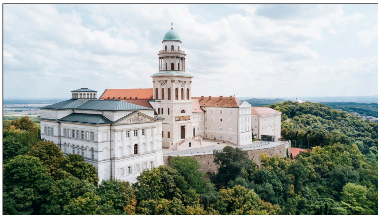
A Pannonhalmi Főapátsági Könyvtár épülete

A könyvtárosok, akik híresek arról, hogy nyitottak az újdonságokra, készek a tanulásra, kreatívan reagálnak a változásokra, nyugodt munkával és eredményesen végezték-folytatták munkájukat a pandémia ideje alatt.