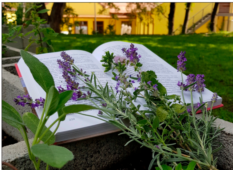
Az Ezüstbgyi Könyvtár udvarán

„Micsoda gazdag forrás a növényvilág a toll, az ecset és a fényképezőgép számára! Egy gyereknek pedig varázslat, ahogy a földbe ültetett gumóból egy gyönyörű virág sarjad.” Jane Goodall