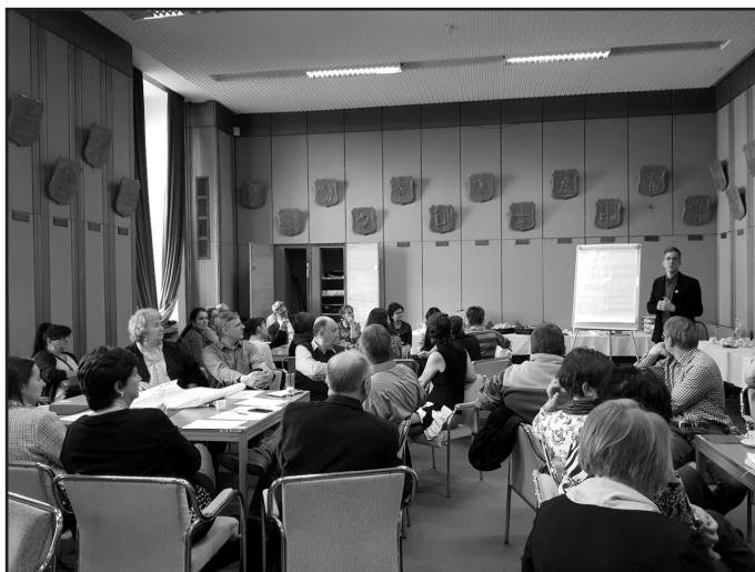
A workshop résztvevői

A workshop lényeges része volt, hogy a részt vevő kollégák megfogalmazták azokat a kérdéseket, javaslatokat, tapasztalatokat, amelyek az adatvédelmi rendelet alkalmazása kapcsán felmerülnek a könyvtáraikban és válaszokat szeretnének rá kapni.