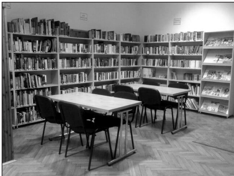
A Csorba Győző Könyvtár Pécsbányai könyvtárpontja

MT: A mi könyvtárpontjaink még fiatalok, de reményt adhat az, hogy a helyi közösség igen aktív ezeken a településrészekben, és a korábbi állományt is használták, igaz, nem nagy intenzitással. Bízunk benne, hogy a megújult állományunkat szívesen forgatják majd. Terveink szerint a helyi civil szervezetek munkatársainkkal közösen könyvtári programokat is szerveznek majd a közösségek számára.