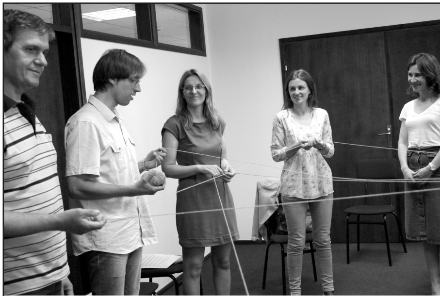
4. kép Tapasztalatok megosztása a gyapjúlabda dobálásával. Ez a workshop zárása. Mindenki megoszthatja a saját pozitív illetve negatív gondolatait az eseményen tapasztaltak kapcsán

A grafikus elemzés láthatóvá teszi a konfliktusban részt vevők igényeit. Az ellentétes oldalon állók közös érdekeire, aspektusaira összpontosít (pl. a kollégák közös érdeke a projekt befejezése a szükséges határidőig, bár az egyikük késik a feladata teljesítésével).