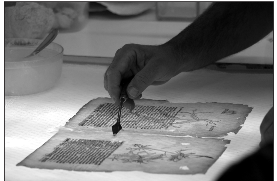
A könyvrestaurálás folyamata - Papírontás