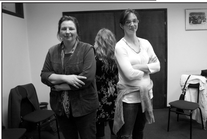
3. kép A nonverbális kommunikáció. Testbeszéd. Együttműködés kontra versengés szobra