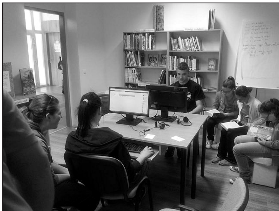
Könyvtárpont Nagymacson