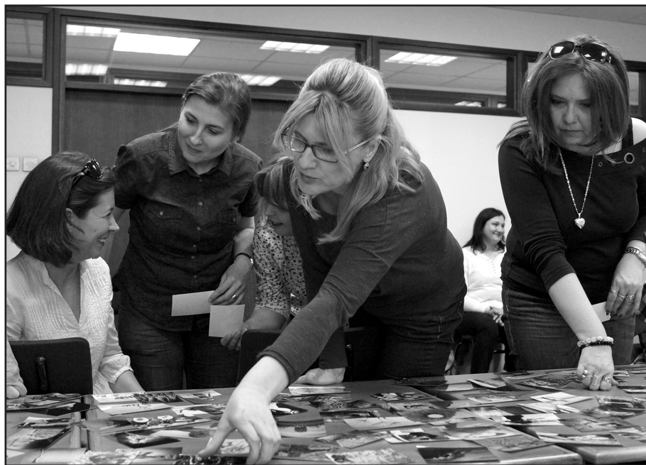
2. kép: Projektív technika, út a tudattalanhoz. A képek tudattalan vizuális ösztönzést nyújtanak a jelentés megtalálásának irányában. Gondolj a könyvtári konfliktusodra, s válassz egy olyan képet, amely leginkább leírja azt! Indokold is meg a választásod a többiek számára.

kiabál veled, vagy ha az ügyfél megsért téged). Egyensúlyban kell tartani a negatív szülői énképedet, amely a túlzott kritikák megfogalmazásáért felelős.