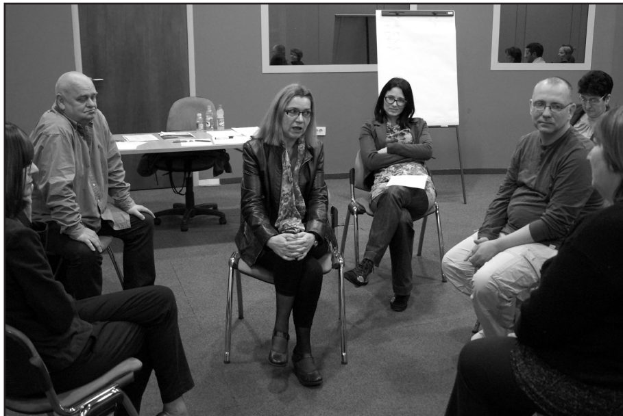
1. kép Figyelmes hallgatási gyakorlat.

lenni, s védekező módon reagálunk. Azt halljuk, amit hallani akarunk, s nem azt, ami valójában elhangzott. Nagyon érdemes további magyarázatot kérni arról, ha valami nem világos; illetve a megismétlést, összefoglalását kérni az elhangzott beszédnek. „Ha jól érttem az álláspontod a következő...”