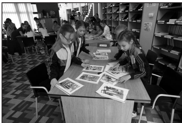
Csoportmunka a döntőn