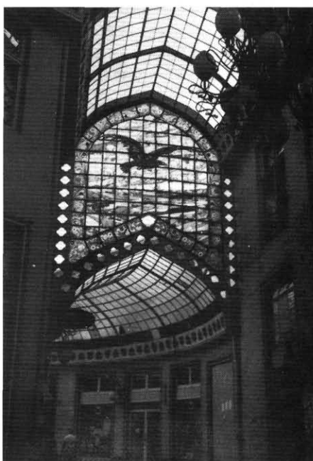
A Fekete Sas palota passázsa

Ha hiszünk ebben, akkor kellőképpen tiszta fogalommal kell hogy rendelkezünk az irodalom valódi és lehetséges jelentőségéről és feladatairól társadalmunkban – de attól tartok, hogy itt van a kutya elásva.