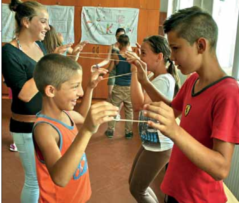
Nyári napközi Fedémesen

nemcsak Egerben, hanem más településen, például Hevesen (Hevesi járás) vagy Fedémesen (Pétervársárai járás) is beindításra került.