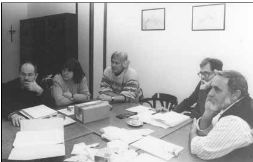
Közösségszolgálat Alapítvány 1994. Dobogókő

Szerintem a szakmában sokan nem értették őt. Pedig nem volt semmi bonyolult abban, amit mondott vagy csinált. Volt valami szelidség a személyiségében, ami sok