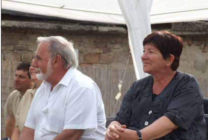
Koppánymonostor, MAG-ház avatás, 2008.

Közösség és művelődés. A helyi aktivitásokon keresztül gondolom összetartozónak ezt a két fogalmat. Nem hiszek abban, hogy „kívülről” lehet közösséget művelni, művelődni. Csak akkor lehet, ha bevonódik