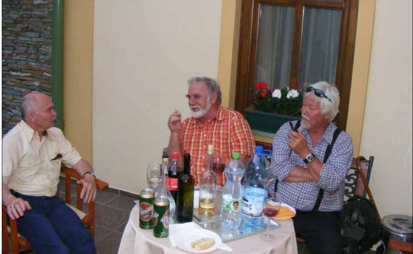
„Fecsegés” a Herényiek Háza teraszán

aztán ismét azt tette, amit mindig is cselekedett. A közösségi művelődés ügyét szolgálta a határokon innen s túl.