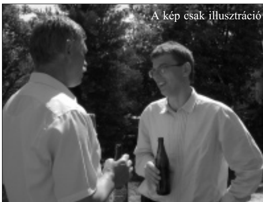
A kép csak illusztráció

Amikor az ikrekkel várandós voltam, a 30. héten megindultak a fájások. A kórházban infúzióval le tudták állítani. Rengeteg idő volt még hát-