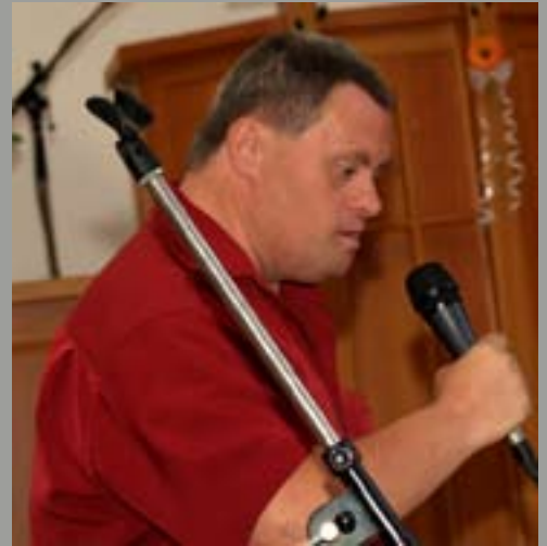
SŐNTHA KRISZTINA FOTÓI