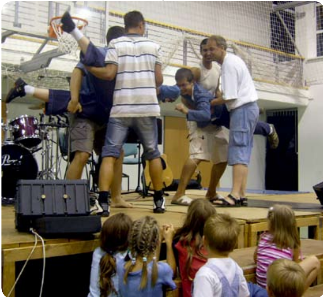
Fotó: Szabó Borika