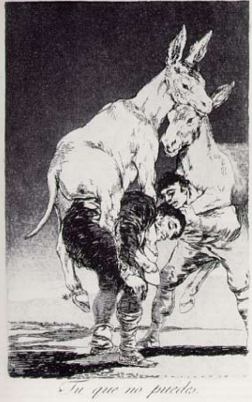
Parlament választások ma.

Egykoron még Árpádot emelgettük pajzsháton... Francis Goya, "Tu che no puedes" (Te, aki nem tudod), 1797-98. Grafika.