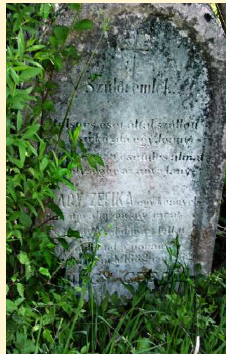
Sírverssel ellátott síremlék