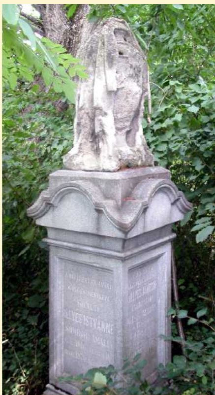
A sófalvi Illyés család síremléke

5. Szám nélküli iratok tanúsága szerint a székesi református parókia levéltárában.