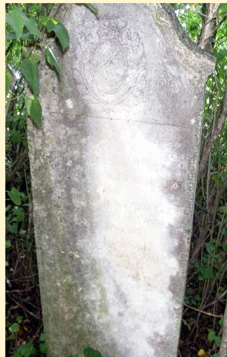
Címermintával díszített sírkő

Véleményem szerint a székesi református köztemető egy kőbe vésett, „nyitott történelemlékönyv”, nemcsak a néprajzkutatók, művészettörténészek,