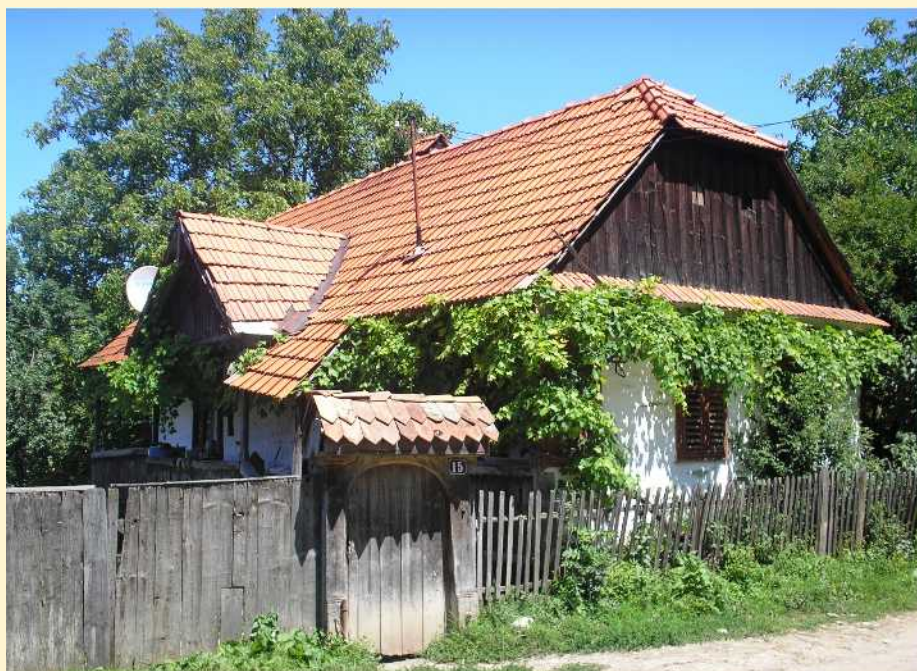
Lakóház Sándortelkén

Társadalmi erőforrások tekintetében Sándortelke egy távlati kilátásokkal bíró közösségnek tűnt a XX. század közepén. Lehetséges aktív munkaerőként tekinthető a lakosok több mint kétharmada. 52 (29 fiú és 23 lány) kiskorúról van tudomásunk, a 65 évnél idősebb generációt mindössze 15 személy (7 férfi és 8 nő) alkotta. Az előző két generáció közötti 99 lakos (55 férfi és 44 nő) képezte a gazdaságok legfontosabb munkaerőjét. Ugyancsak közülük voltak megjelölve a beszolgáltató termelőegységek tulajdonosai is. Négy olyan család létezett a faluban, amelyek esetében a termelői tevékenység 65 évnél idősebb személyekre hárulhatott. Valójában mind a négy esetben birtokfelaprózásról beszélhetünk, hiszen annak ellenére, hogy különálló gazdaságokként vannak iktatva, gyakorlatilag a fiatalabb generáció képviselőivel egy házszám alatt tűnnek fel. Feltételezésemet az is bizonyítja, hogy az állatállomány a fiatalabb gazdák tulajdonaként szerepel, mi több, egyik esetben az idős gazda tulajdonaként mindössze 10 ár összterület van feltüntetve. Az egyazon háztartás, a követhető fiú–apa vagy vő–após viszony, valamint a birtokstruktúra, az állat- és szerszámállomány vizsgálása során 13 esetben dokumentálható a tudatos birtokaprózás. Mindössze az életkorra alapozva nem ítéhető meg pontosan, hogy hány esetben beszélhetünk háromgenerációs családról, de a taglalt 13 esetben bizonyítható a (legalább) három generáció egy fedél alatti léte, közös gazdálkodása.