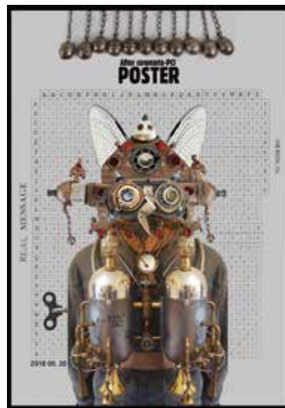
Fotó: Horkay István

Vigadó tér 2.), magyar, lengyel, cseh és szlovák művészek munkáin keresztül enged betekintést a nemzeti sajátosságokat felvonultató kulturális plakátok történetébe, valamint ifjú plakáttervezők legfrissebb alkotásait is láthatja a közönség. A képen Horkay István plakátja.