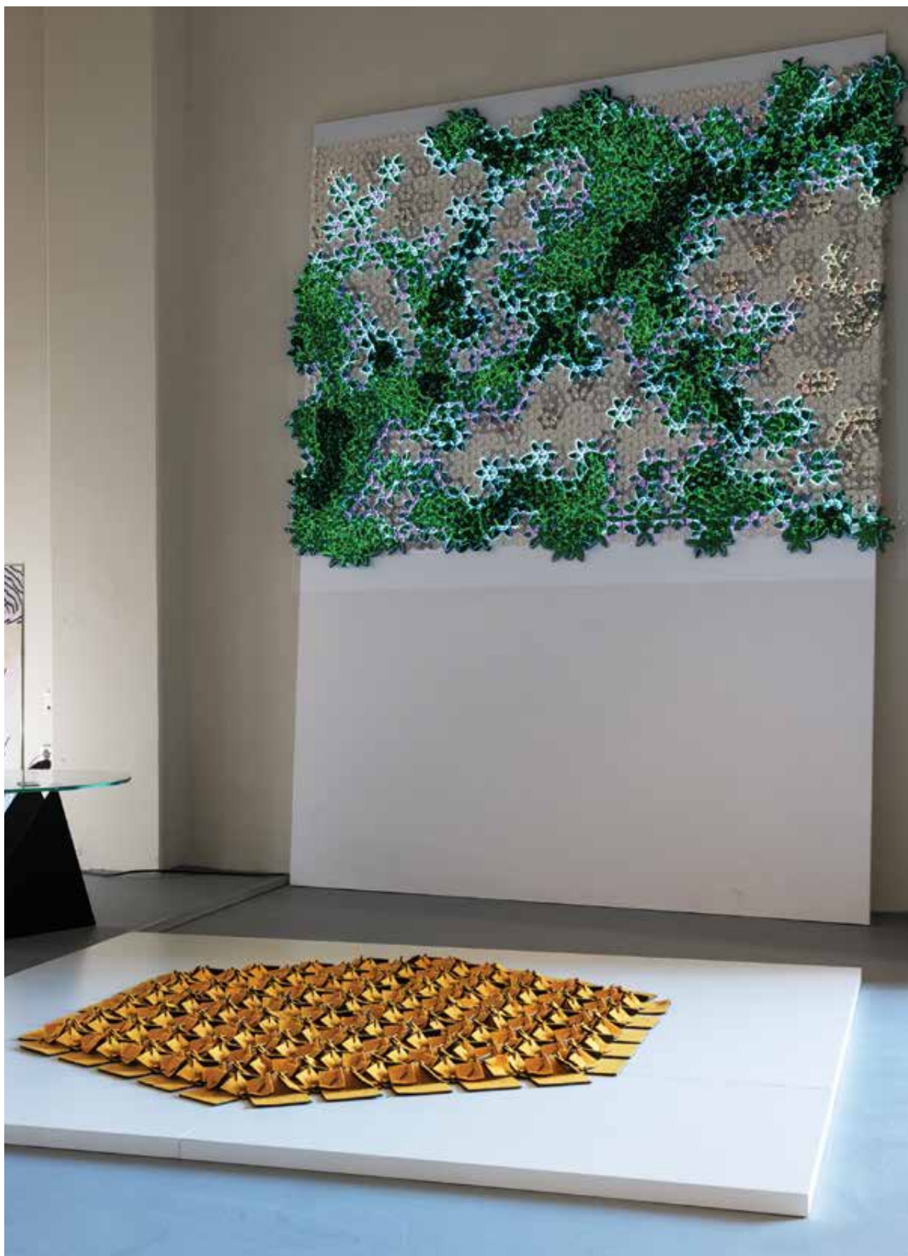
KALÁCSKA Zsana: Glowing Garden – VIVOID Green Wall, video mapping | Zsana KALÁCSKA: Glowing Garden – VIVOID Green Wall, video mapping 2021, gyapjúfilc, egyedi struktúradesign, 150x200 cm