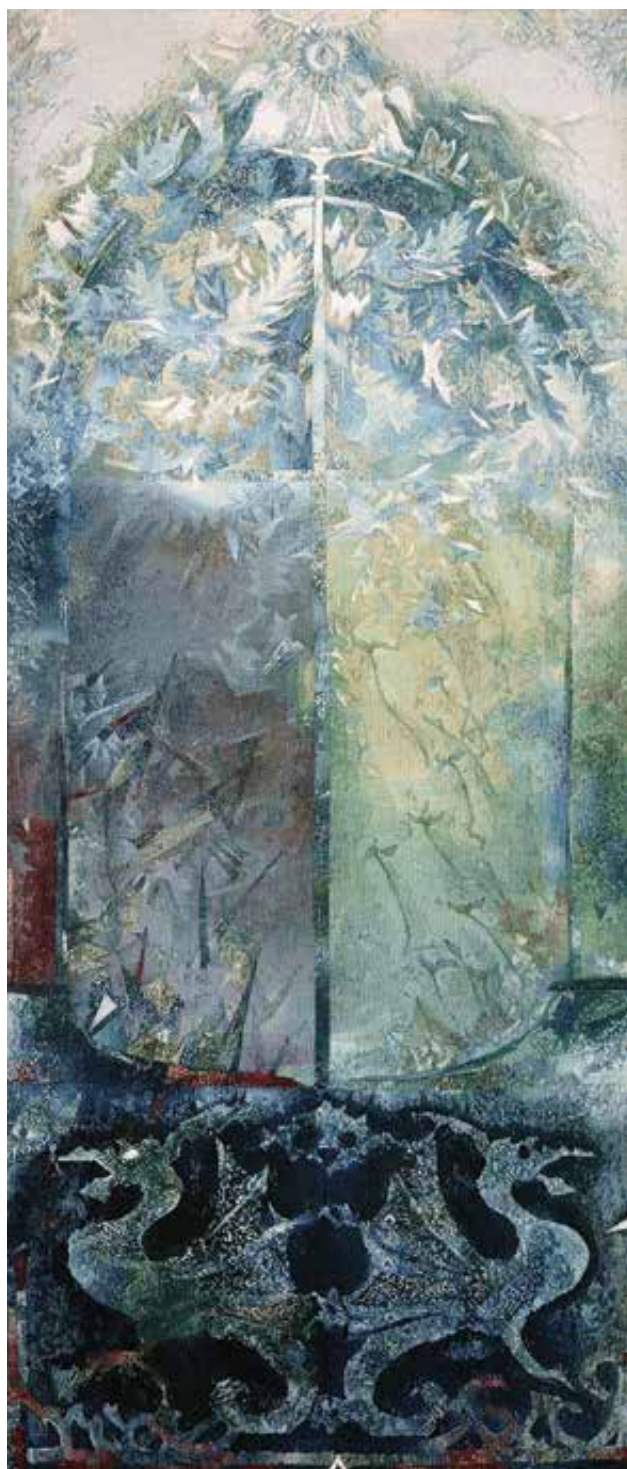
^ MÁDER Indira: „A Mindent Mozgatónak glóriája...” Indira MÁDER: 'The Glory of Him who Moveth Everything...' Gyapjú, selyem, haute-lisse, 5,5-ös felvetés, 221x96 cm