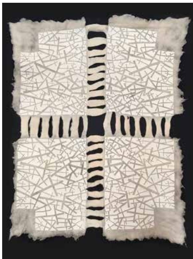
JÁSZBERÉNYI Matild: Isten Báránya, oltárterítő | Matild JÁSZBERÉNYI: Lamb of God, altar cloth | Nemez, szitanyomás, gyapjú, 135x110 cm