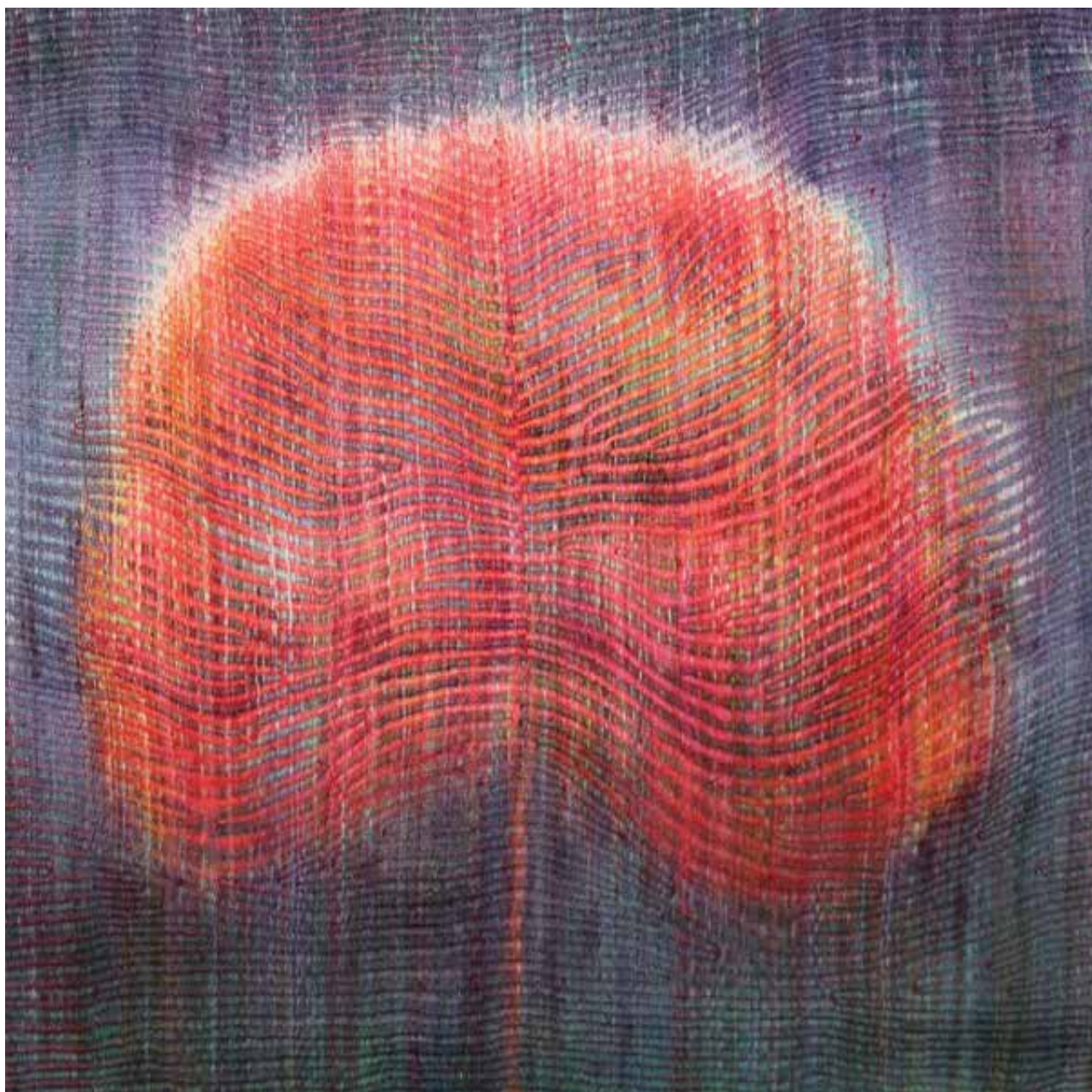
SOMODI Ildikó: Dicsőség tükre I. | Ildikó SOMODI: Reflection of glory | Egyéni ikattechnika, 45x45 cm