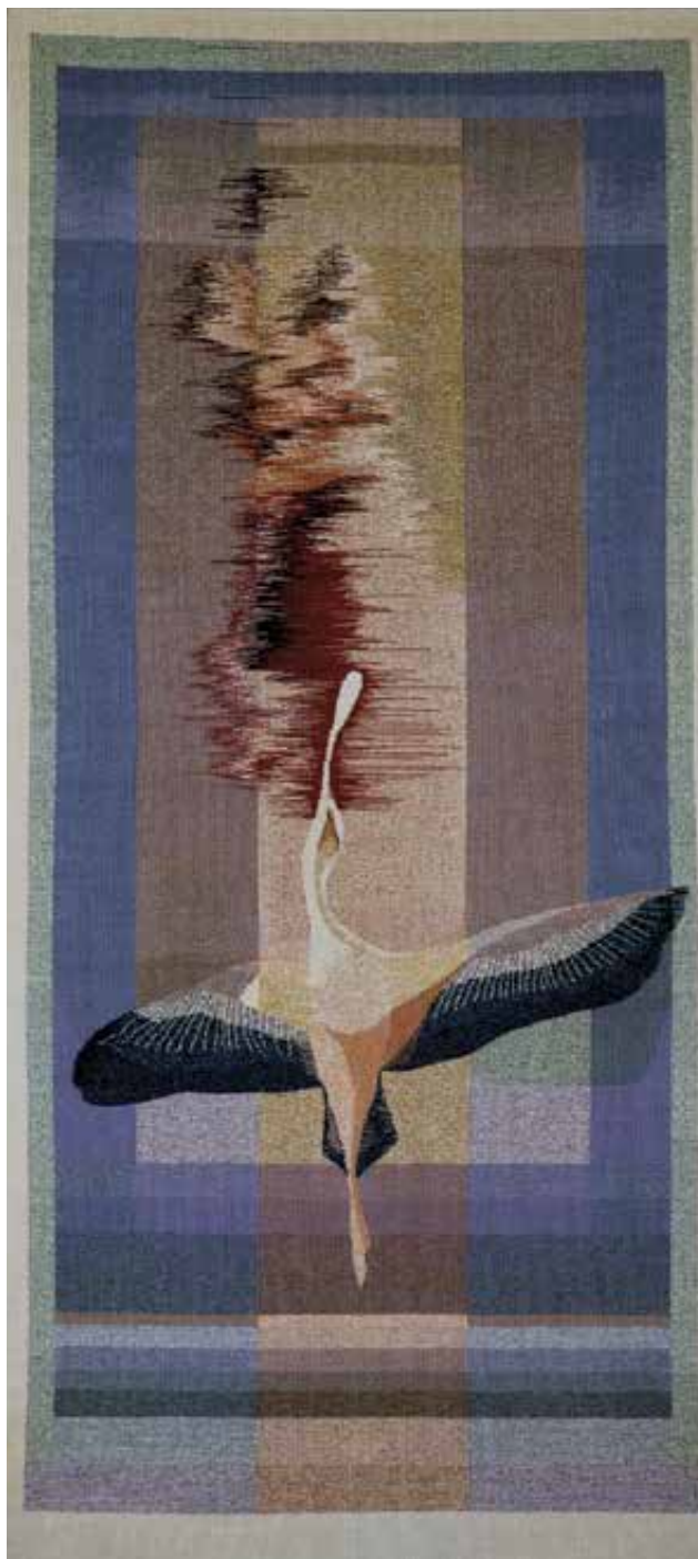
VÁSÁRHELYI Kata: Cantus Avium | Kata VÁSÁRHELYI: Swan song Gyapjú, francia gobelin, 200x100 cm

Láng-Miticzky Katalin ...és beleremegett az ég című gobelinjének gyapjú- és szizál-kender szálból készült kompozíciója a felfelé törő határozott egyenesekkel segíti a Remény diadalát az élet sötétebb és fénylőbb közegei közepette érvényre jutni.