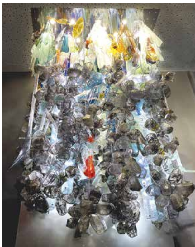
FARKAS Éva: Fájront – Bányászaink emlékére, térplasztika, Reimann Bányászattörténeti Miniverzum, Dorog | Éva FARKAS: Knocking Off – sculpture in tribute to our miners. Reimann Mining History Miniverzum, Dorog | 2021, fűjt és rogyasztott üveg, fém, 300x200x100 cm

birtokbavételének szándékát és reményét is jelzi: azt, hogy a mű jelenléte, fennmaradása nemcsak rövid évekre, hanem évtizedekre, talán évszázadokra is garantált. E követelmény, e jellemző egyúttal azt is feltételezi, hogy mind fizikai tulajdonságai, mind tartalmi jegyei révén az alkotás szervesen illeszkedjen befogadó környezetéhez: a művet körülvevő modern építészeti közeghez, amely célzatosan létrehozott, gyakorlati funkciókat szolgáló,