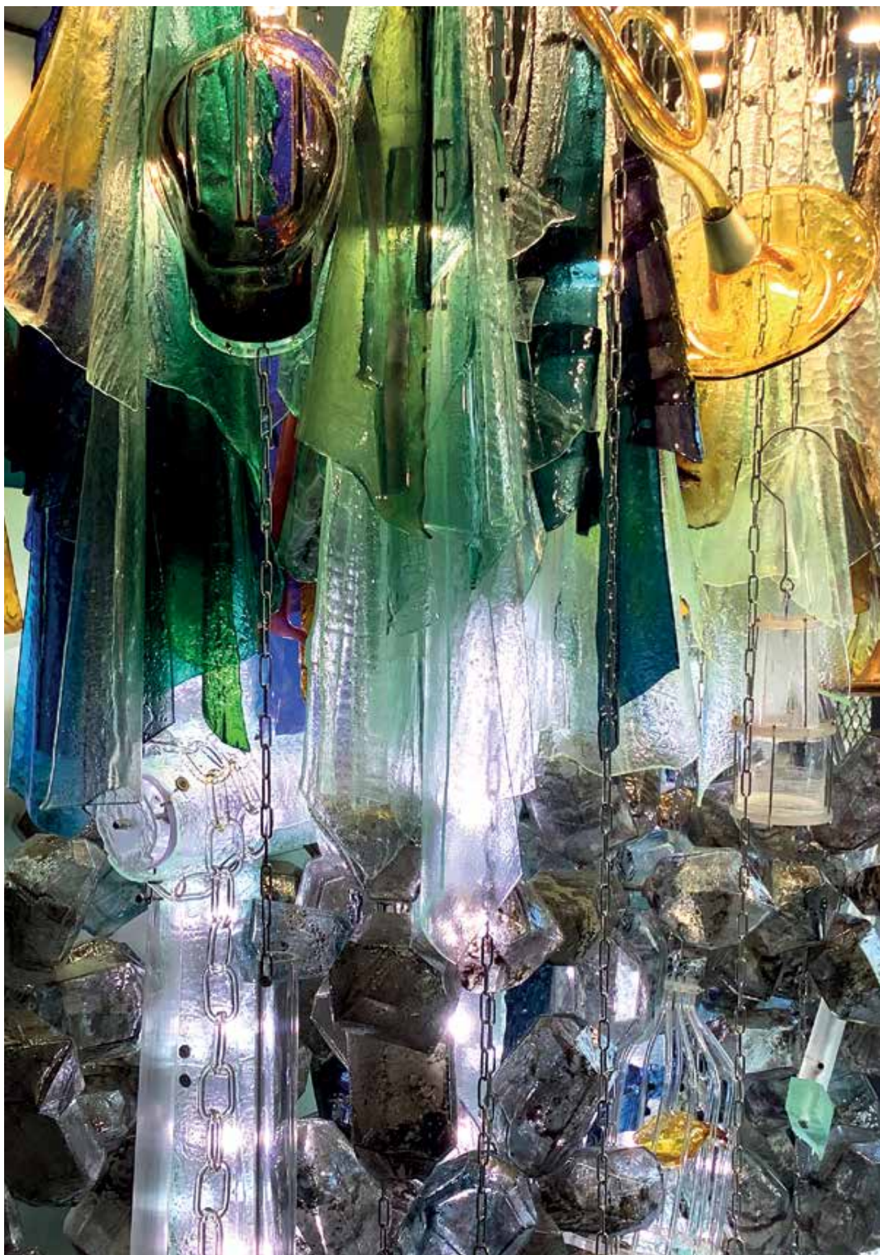
FARKAS Éva: Fájront – Bányászaink emlékére, térplasztika (részlet) | Éva FARKAS: Knocking Off – sculpture in tribute to our miners (detail)