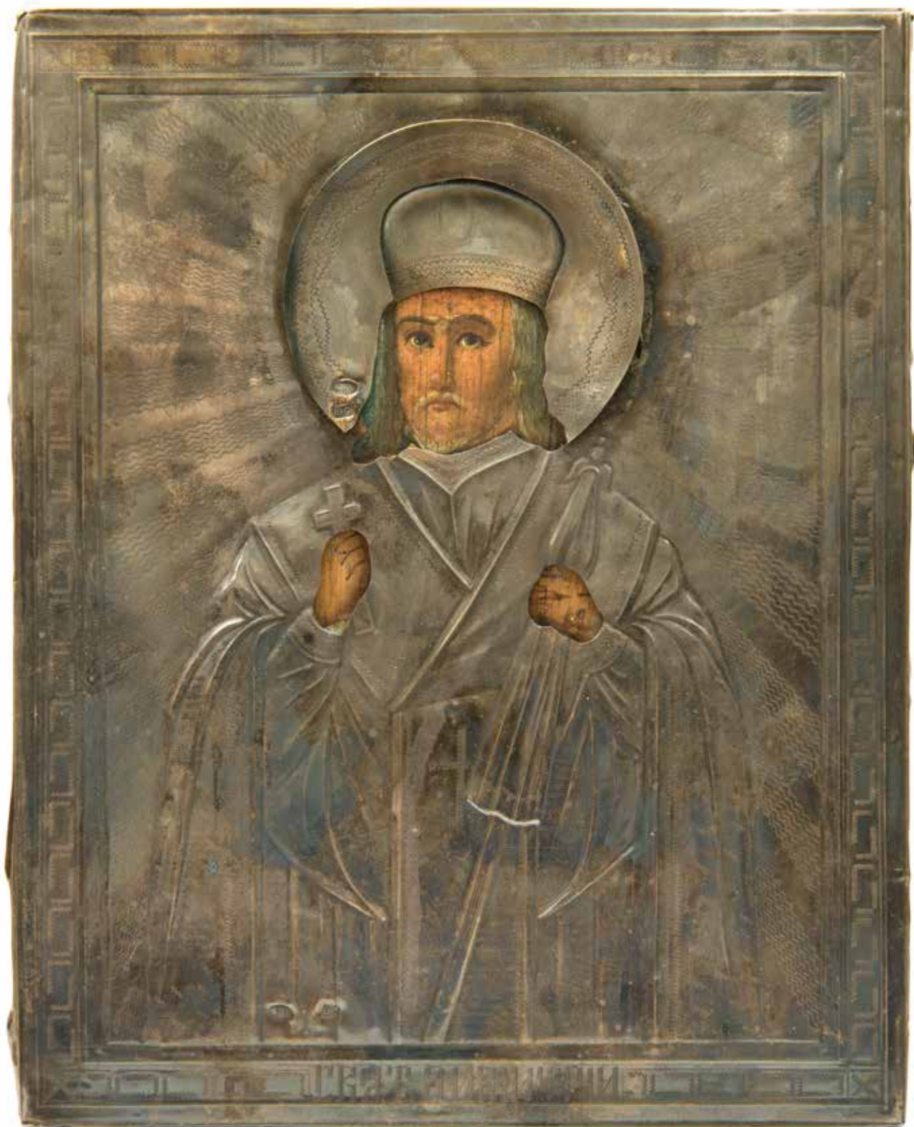
E. G. mester: Rosztovi Szent Demeter | Master E. G.: St. Dimitry of Rostov Moszkva, 1908–1917, fa, ezüst, 22x17,3 cm (magángyűjtemény, ltsz. 62)