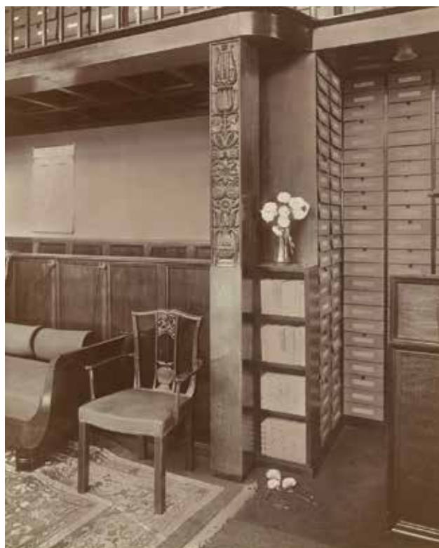
KOZMA Lajos: Rózsavölgyi Könyv- és Zene-műkereskedés berendezése, Budapest, Szervita tér 5. | Lajos KOZMA: Furnishing of the Rózsavölgyi Book and Music Store, No. 5, Szervita sq., Budapest | 1912, archív fotó (Iparművészeti Múzeum, Adattár, Budapest)

hátsó helyiségének galériát tartó, hasáb alakú pillérei Kozma (és Lajta) kedvelt plasztikus növényi ornamenteivel voltak díszítve, melyekhez hasonló, inkább angolos motívumok a kevés berendezési tárgyon: a székek áttört támláján is megjelennek. (Utóbbiak az Iparművészeti Múzeumba kerültek.) Az alapvetően geometrikus terekben és struktúrákban gondolkodó „bécsi műhelyek” szecessziós stílusát ezek a motívumok helyhez kötik, és – biedermeieres vonásokkal gazdagítva (például a két tér közti átjáró ívelt kerete) – a polgárosodás hőskorához is. (Keserü Katalin)