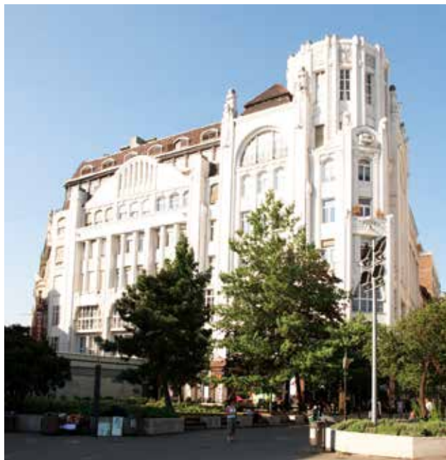
KOLLÁR József – RÉVÉSZ Sámuel: Modern és Breitner áru- és bérház, Budapest, Deák Ferenc u. 23.

csatlakozik a sarokhoz, kétoldalt pilléreként keretezi a fal, melyet felül egy-egy geometrikusan megformált robusztus férfialak zár. A tér felé néző homlokzat középső részét ívelt oromzat fogja össze, oldalt egy-egy pillér keretezi, melyek különlegessége, hogy felül a sarokra kialakított maszkban végződnek. A maszk alatt férfifigura görnyed, mellette női figura a pillér szögletes formáiba simulva. A harmadik