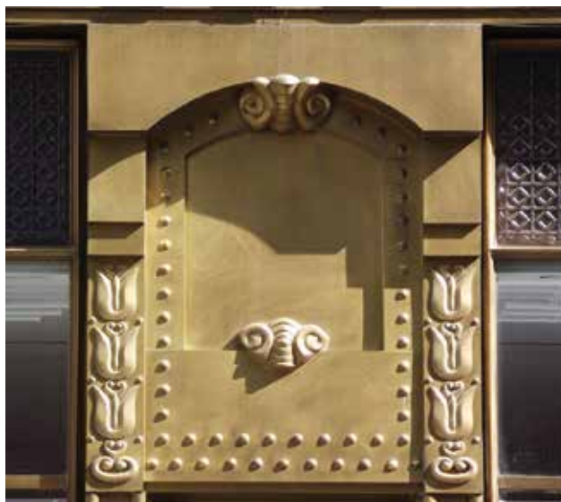
Földszinti üzletportál részlete, Budapest, Deák Ferenc utca 17. Shop facade on the ground floor, No. 17, Deák F. st., Budapest Fotó: Brunner Attila, 2021

eredetileg csak a hátraugratott emeleteken alakítottak ki lakásokat, felettük a tetőtérben két műterem épült. Az udvar üvegtetővel fedett kétharmadát is az üzletek helyiségei foglalták el. A lakásokhoz vezető lépcsőterek az áruházi részhez idomultak. A kapualjban egykarú lépcső vezet a magasföldszintig, csak innen indul a tágasabb, világosabb, íves karú lépcső az utcai szárny udvari szakaszához építve. Az utcai front fémszerkezetével és nagy méretű üvegfelületeivel a korszak áruházépítési gyakorlatának felel meg. Az üvegezett felületet teljes magasságában átfogó szegecselt oszlopok adják a szerkezet vázát, a burkolatok is fémből készültek. Az utcai homlokzati rész 1912-es szerkezeti rajzai a levéltárban a Kőbányai Gép- és Vasszerkezeti Műhely pecsétjével találhatók meg, van továbbá Gut Árpád és Gergely Jenő vasbetontervező irodájától egy 1912-es vasbetontervsorozat, az udvari vasszerkezetű üvegtetőről pedig a Luxfer Prismagyár (Haas János és Somogyi Károly üzeme) pecsétjével.