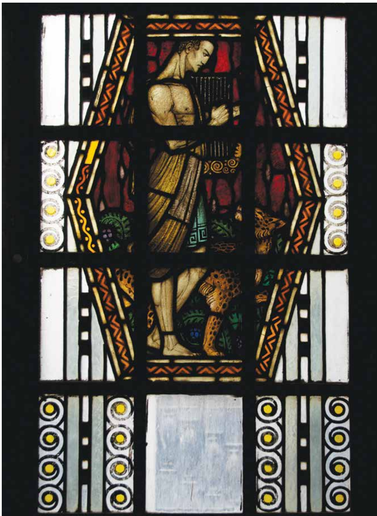
MARÓTI Géza: Orpheusz alakja a főlépcsőház első emeletének középső üvegablakán (kivitelezés: RÓTH Miksa), Kasselik-ház, Budapest, Vörösmarty tér 3. | Géza MARÓTI: Figure of Orpheus (executed by Miksa RÓTH) on the middle window of the main staircase, first floor, Kasselik house, No. 3, Vörösmarty sq., Budapest