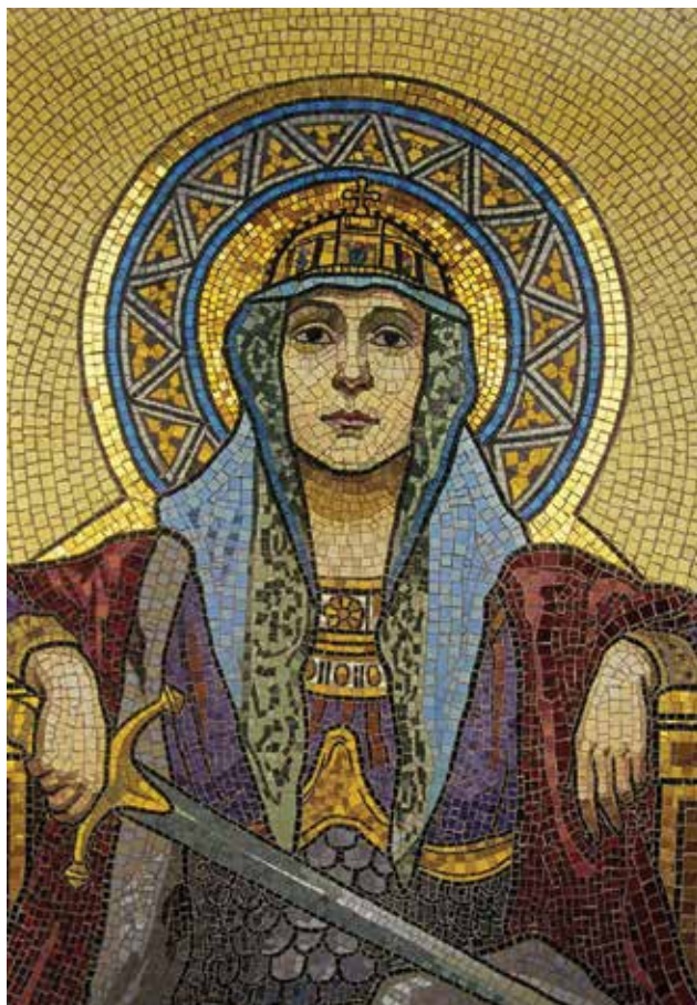
RÓTH Miksa: Hungária alakja a Török-bankház homlokzati mozaikjáról (restaurált állapot, 2008) | Miksa RÓTH: Figure of Hungaria from the facade mosaic of the Török banking house (after restoration, 2008)

Az épület zárt sorú beépítésben álló, magas tetős, négyemeletes bankház, ma üzlethelyiségekből és lakórészből áll. Homlokzatát vas-acél szerkezetű tartóváz és az ebbe illeszkedő üvegfal alkotja, kialakítása