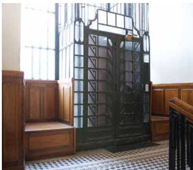
Főlépcsőház fordulója a lifttel a Modern és Breitner áru- és bérházban, Budapest, Deák Ferenc u. 23.

Main staircase landing with the elevator, Modern and Breitner store and residential building, No. 23, Deák F. st., Budapest