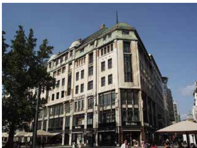
KORB Flóris – GIERGL Kálmán: Kasselik-ház, Budapest, Vörösmarty tér 3. Flóris KORB – Kálmán GIERGL: Kasselik house, No. 3, Vörösmarty sq., Budapest | 1910–1912

A hatalmas homlokzatfelületek alakításánál főként a négyszögek uralkodnak, a nemes anyagokkal együtt elegáns, szigorú hatást keltve. A díszítés leegyszerűsített geometriai formákból áll, főként a négyszög változatai, például fogsor és vájatok. A fémfelületeken néhol csigavonalban csavarodó levélforma is megjelenik. A tető alatti szinten loggiákat alakítottak ki, itt hangsúlyosabban jelenik meg a vöröses kőburkolat, amelynek ornamentikája felnagyított gyöngysorhoz hasonlít leginkább. (Rákos Kata)