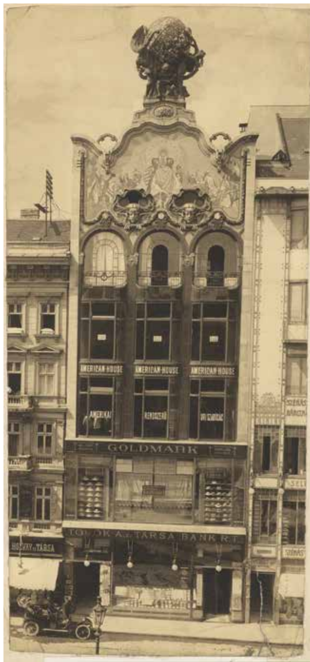
BÖHM Henrik – HEGEDŰS Ármin: Török-bankház, Budapest, Szervita tér 3. Henrik BÖHM – Ármin HEGEDŰS: Török banking house, No. 3, Szervita sq., Budapest | 1906 után, archív fotó (Fővárosi Szabó Ervin Könyvtár Budapest Gyűjteménye)

szimmetrikus, háromtengelyes. A két alsó szinten az üzletportálok miatt eltér a pillérkiosztás, a tartószerkezet előtt nagyvonalú üvegfal húzódik a homlokzat teljes szélességében. A földszint és az első emelet fölött két erőteljes cégérsáv fut fekete üvegezéssel, a földszinti kirakatokat konzolos lámpák világítják meg. Az első emelet fölött a homlokzat vertikális hangsúlyt kap. A „csupa üveg” homlokzatot mészke lizénák keretezik, az oromzatot hullámszó, erőteljesen tagozott koronázópárkány zárja. Az épület a nyugat-európai art nouveau vegyes típusú