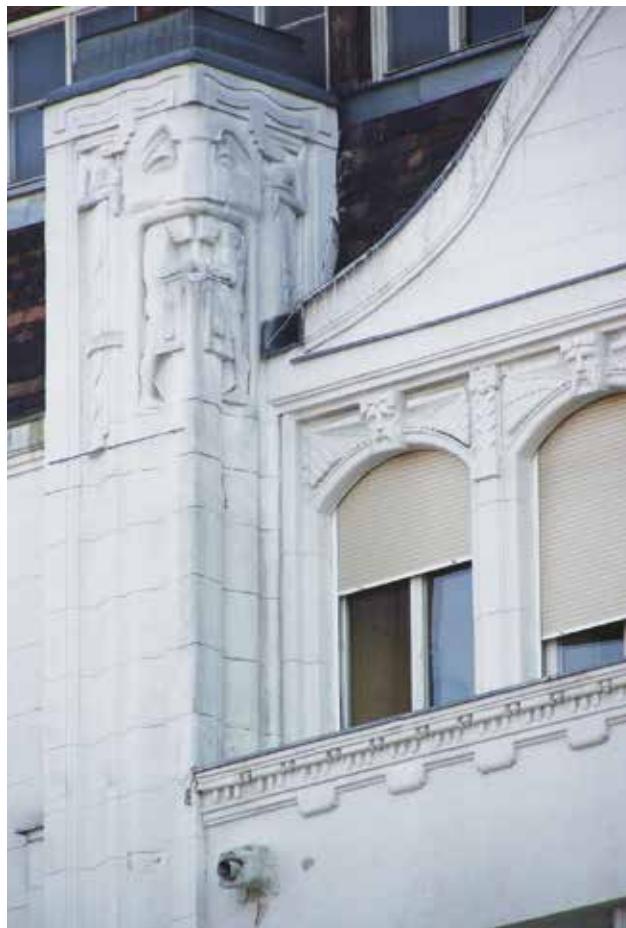
Oromzati pillér maszkos díszítéssel a Modern és Breitner áru- és bérház tér felé néző homlokzatán, Budapest, Deák Ferenc u. 23.

szinten a késő szecesszióra, art decóra jellemző trapéz nyílásokat alakítottak ki. Az udvar többszörösen átépített képe alig tükrözi az eredetit. A belső rész különlegessége a szintenként két oldalról pihenőkkel övezett liftház.