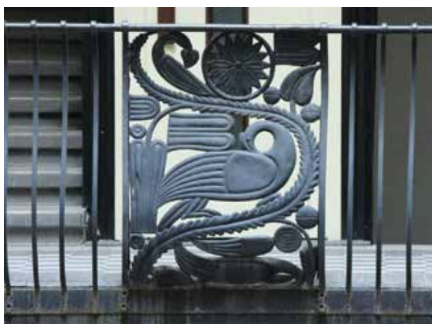
Gangkorlát részlete, Budapest, Szervita tér 5. Detail of a hanging gallery, No. 5, Szervita sq., Budapest

A ház díszítményeinek egyik forrása a sárközi menyasszonyi főkötők végére varrott, selyemszállal hímzett textilsávok, azaz a bíborvégek ornamentális világa volt. A másik fő forrást a Pozsony és Nyitra megyei szlovák hímzések jelentették, elsődlegesen a kötényvégek fehér hímzett szegélyeinek motívumanyaga. A virágmotívumok e sárközi és szlovák hímzéseken egyaránt erősen stilizálva, szinte geometriai formákká egyszerűsítve jelennek meg, az egyes formaelemek sávokba rendezve sorolódnak egymás után. E népművészeti ornamentikát Lajta számára bizonyára az tette vonzóvá, hogy eredeti karakterének megtartásával lehetett architektonikus szerepbe emelni.