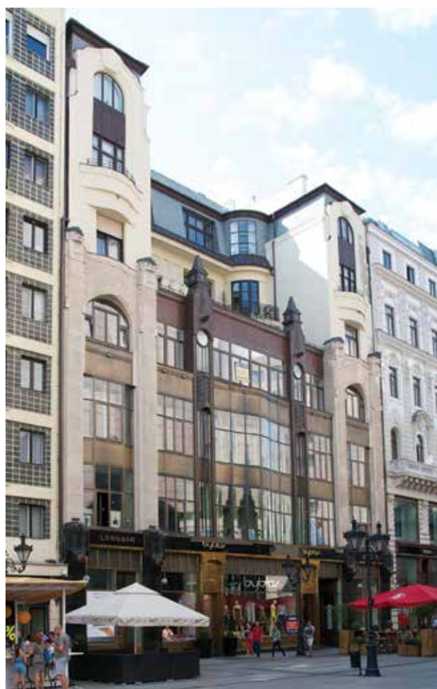
KOLLÁR József – RÉVÉSZ Sámuel: Üzletbérház, Budapest, Deák Ferenc utca 17. | József KOLLÁR – Sámuel RÉVÉSZ: Commercial and residential building, No. 17, Deák F. st., Budapest | 1910–1913

A homlokzat középső részén üveg- és rézfelületek váltakoznak, amelyek három szintet átfogva függönyfalként takarják a mögötte húzódó ablakokat. A felület közepén enyhén domborodik, az üvegtáblák is ívesek. Az ívelt részt kétoldalt függőleges, bronzszínű fémlemezekből és csövekből kialakított, pillérszerű osztás keretezi, melyet felül sematizált leomló füzér díszít. Az üveges homlokzatot egy-egy toronyszerű traktus fogja közre. A traktusok alsó három szintjén kőburkolatos pillérek keretezik a nyílásokat, melyek geometrizált oroszlánfejekben végződnek. A felső három lakószint vakolt, erkélye enyhe hullámot visz a homlokzatba. Az épület az art decóba forduló szecesszió példája. Az ornamentika visszafogott: helyét az anyagok veszik át, illetve a monumentális építészetből átemelt formák. De mellettük feltűnik a népművészetből ismert virágmotívum-sor, egy-egy sematizált antikizáló levél, maszk, továbbá enyhén íves geometrikus vonalak az egyes befejező elemeknél. (R. K.)