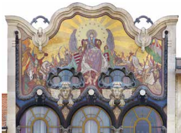
RÓTH Miksa: Hungária megdicsőülése, a Török-bankház homlokzati mozaikja (restaurált állapot, 2008) | Miksa RÓTH: Apotheosis of Hungaria, facade mosaic on the Török banking house (after restoration, 2008)

A IV. emelet félköríves záródású ablakai előtti erkélyrácsokat horganyöntvény fűzérplasztikák díszítik. Ugyancsak horganyöntvény, leveles és gyümölcsfűzér keretezi az oromzat üvegmozaikját lent és kétoldalt. A két lizéna fölött egy-egy kőből készült szárnyas Hermészfő (vagy Medúzafő) plasztikusan megformált arca tekint előre, a fölöttük nyíló, különleges formájú ablakokat dekoratív hullámokba rendeződő, horganyöntvényből készült kígyók fonják körbe. Az épület plasztikai díszítése Ney Simon munkája.