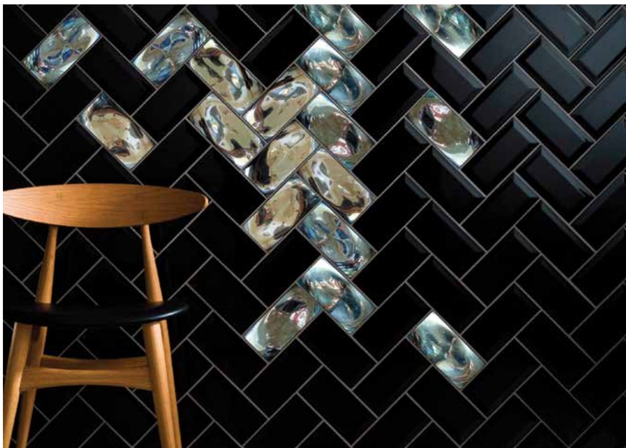
SOLTÉSZ Melinda: Reflexiós üvegburkolat No. 02. Látványterv: MÁRTON László Attila

– Eddigi témáinknak szerintem ez tökéletes összefoglalása. Hiszen, amikor arról beszélünk, hogy nagyon fontosnak tartjuk a pedagógusok részvételét a rendezvényeinken, az maga egy marketing. A szónak nem a klasszikus, hanem abban az értelmében, hogy rajtuk keresztül tudjuk eljuttatni az ismereteinket, amelyek messziről nézve talán elefántcsonttoronyban születnek – holott pontosan tudjuk, hogy ezek nem ilyen jellegű kutatások –, de rajtuk keresztül talán egy közvetítő közeget találunk arra, hogy ezek a kutatások élők, a napi gyakorlatban használhatóak legyenek a szó legjobb