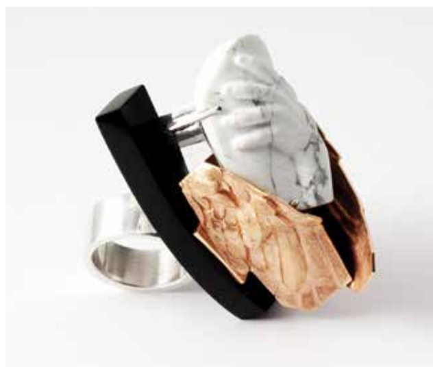
TÓTH Zoltán: Érintés I. gyűrű | Zoltán TÓTH: Touch I ring 2020, ezüst, réz, aranyozás, howlit, corian, 6x5x4 cm