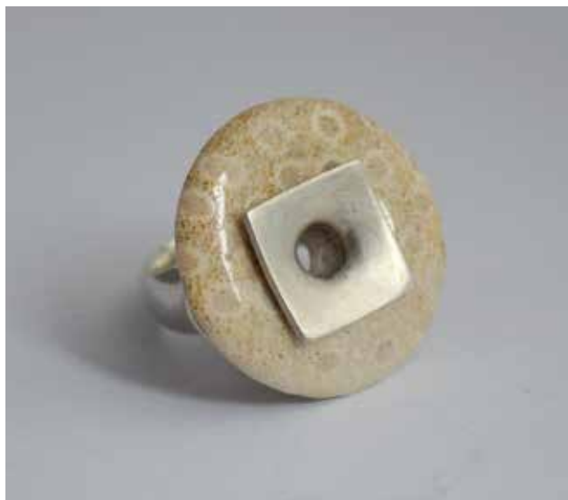
KIRÁLY Fanni: Idő-gyűrű No. 1 | Fanni KIRÁLY: Time ring No. 1 2020, ezüst, korall-achát, viaszveszejtéses öntés, lyukszegecselt foglalás, 2,8x3x3 cm

– Magyarországon a kultúra fogalmát ma is meghatározza az irodalom. Lehet, hogy bátortalanabbak más műfajokban, vagy például nehezebb pályázatot benyújtania egy építésznek, akinek komoly tervrajzokat kellene készítenie. Változott-e vagy ugyanez maradt az arány a második ösztöndíj meghirdetésekor?