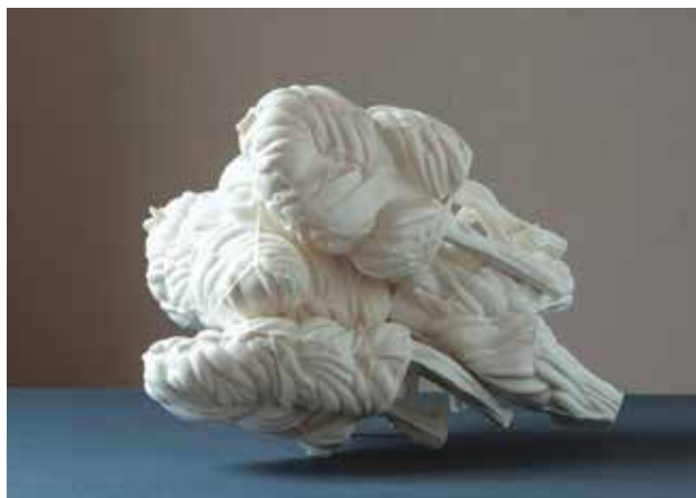
SIMON Zolt József: Sétáló rügy | Zolt József SIMON: Strolling bud 2020, fehér, mázatlan porcelán, 1280 °C, oxidációs égetés, 24x28x37 cm

Akadémiának MMA Kiadó néven szakosított intézménye is van, az ő előkészítő szakmai munkájuk garancia arra, hogy az írott anyagaink elektronikus anyagainkkal azonosan magas minőségűek lehetnek.