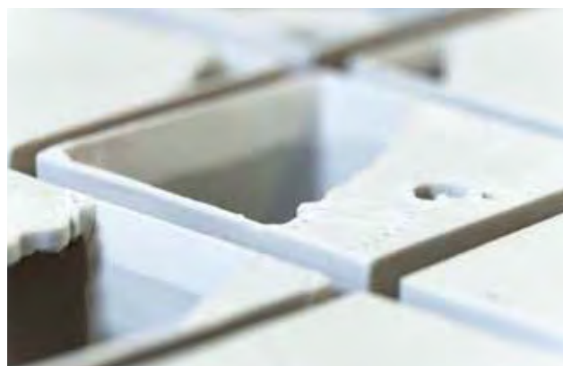
MÁDER Barnabás: Csipke (részlet) | Barnabás MÁDER: Lace (detail)

számára kijelölt helyen, máris sérül a titkos vagy talán inkább csak a megfelelő közelségből kivethető hálózat, az a finom, csipkeszerű minta, amelynek láncolata egyben tartja a kompozíciót. Ez a közösség tehát megbontható ugyan, de akkor értelmét veszti, mert éppen az a kohézió szűnik meg létezni, amely a külső határvonalain túl egyben tartja az egységek kötődését.