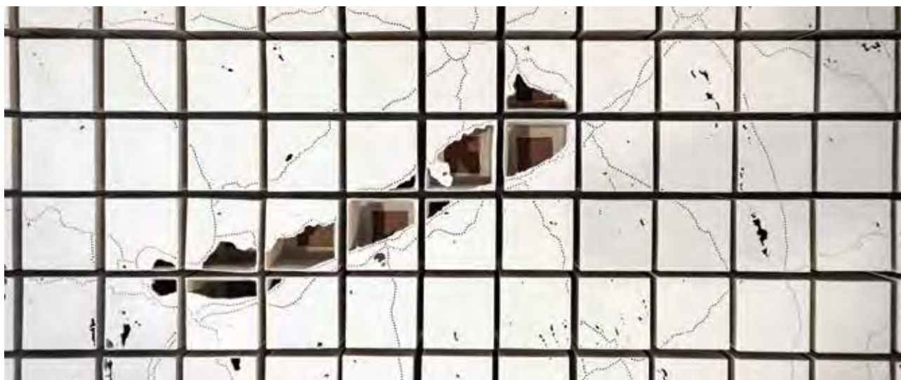
MÁDER Barnabás: Csipke (felülnézet, részlet) | Barnabás MÁDER: Lace (top view, detail)