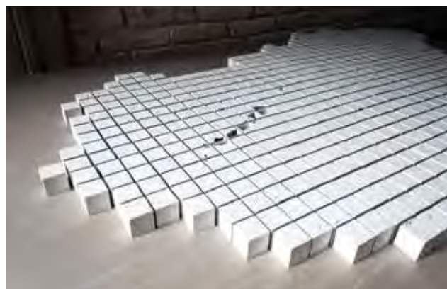
MÁDER Barnabás: Csipke (részlet) | Barnabás MÁDER: Lace (detail) 2019, öntött, mázatlan porcelán, egyedi áttörései technika, a teljes mű: 590 db 4x4 cm-es kocka

Ötszázkilencven darab négyszer négyes kocka. Egyetlen nagy kirakós, amelyben minden kis egységnek megvan a saját egyéni helye, de mindnek konkrét kapcsolata van a mellette állókkal. Az egész azonban mégsem játék, de legalábbis nem hagyományos puzzle. Távolból összeálló egész, közel hajolva elképesztően finom részletek. Ötszázkilencven egyforma különbözőség.