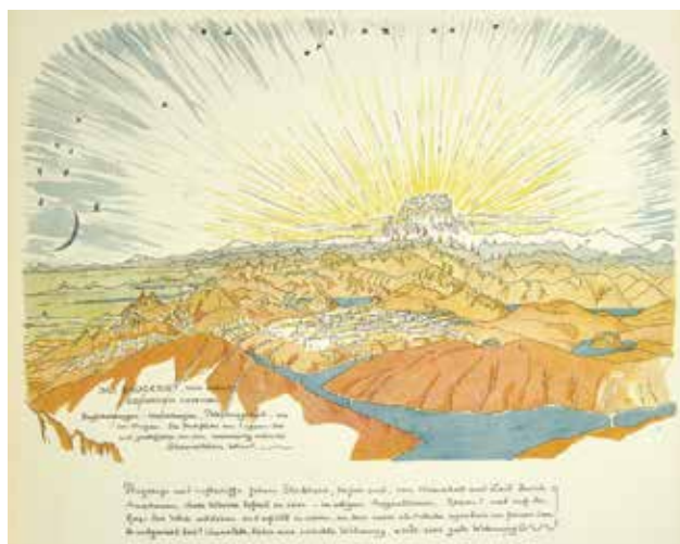
Bruno TAUT: Illusztráció az Alpesi építészet (1919) című kötetből Bruno TAUT: Illustration from the book Alpine Architecture (1919)

Az író és az építész barátságának Scheerbart háború ellen tiltakozó éhségstrájkjából adódó, 1915-ben bekövetkezett halála vetett véget. Taut is hasonló pacifista nézeteket vallott, és számos haladó gondolkodású alkotótársával ellentétben a háborúban nem a társadalmat megtisztító, a nemzetet egységesítő erőt látta. Ezért a katonai szolgálatot lelkiismereti okokból megtagadta, és helyette a scheerbarti üvegutópiák grandiózus léptékű vízióin dolgozott, melyeket a Városkorona ( Die Stadtkrone . Diederichs, Jena, 1919) és az Alpesi építészet ( Alpine Architektur . Folkwang, Hagen, 1919) címeket viselő, gazdagon illusztrált kiadványokban tett közzé 1919-ben. Míg Scheerbart a Harz hegységet és a Fekete-erdőt tervezte megvásárolni a szerény jövedelméből finanszírozott perpetuum mobile kísérleteinek vágyott anyagi sikeréből, hogy helyet biztosítson az írásaiban bemutatott üvegépítményeknek, Taut ennél is grandiózusabb helyszínt, az Alpok hegyláncait választotta társadalomjavító konstrukcióinak.