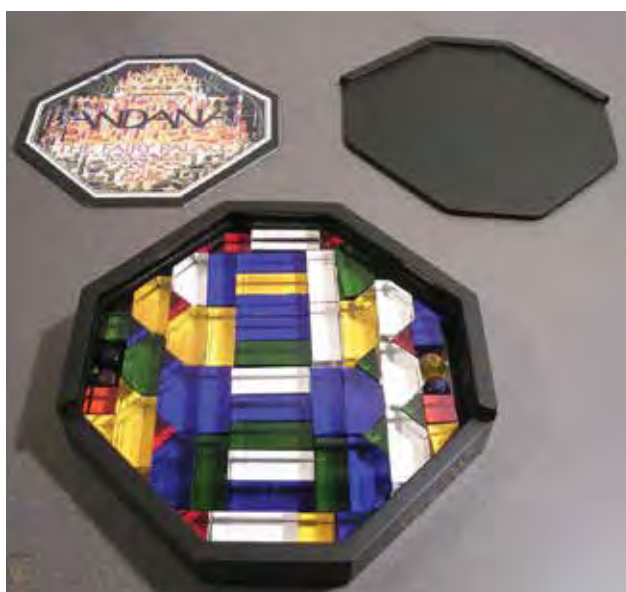
A Vitra cég által utángyártott készlet 2003-ból Set reproduced by Vitra company in 2003