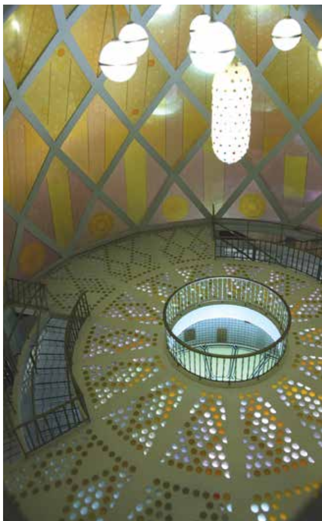
Bruno TAUT: Üvegpavilon, a belső tér makettje a Made in Germany – Politik mit Dingen. Der Deutsche Werkbund 1914 című kiállításon Bruno TAUT: Glass pavilion, mockup of the interior in the exhibition Made in Germany – Politik mit Dingen. Der Deutsche Werkbund 1914 Werkbundarchiv – Museum der Dinge, Berlin, 2014