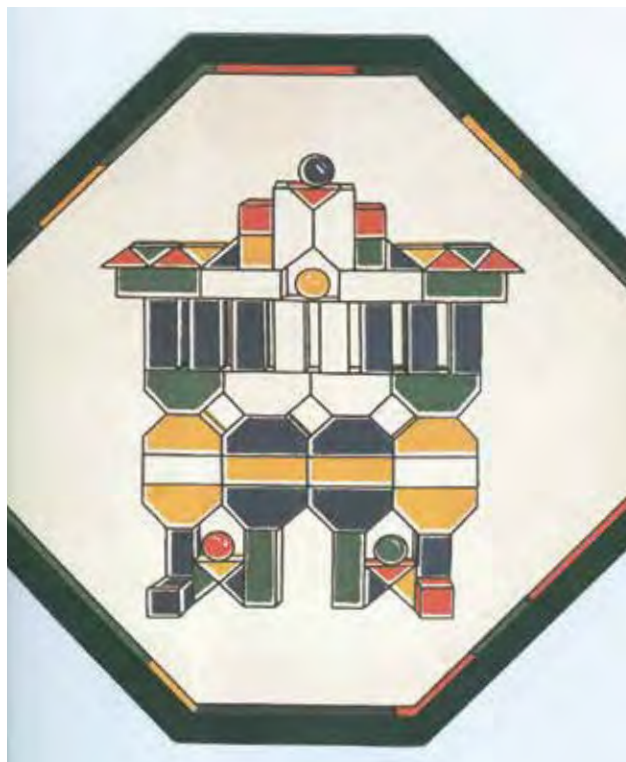
A Dandanah egyik mintalapja – kivitelezhetetlen tündérpalota rajza A pattern sheet of Dandanah – drawing of a fairy palace that cannot be built from the blocks