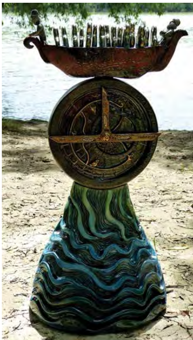
BORSÓDY Eszter: A Mercator mércéje | Eszter BORSÓDY: Mercator's gauge 2019, épített samott, mázazott, lüszteres kerámia, 67 x Ø 35 cm

Borsódy Eszter műhelyében folyamatosan készülnek az újabb tárgyak. Szeret sorozatokban gondolkodni, és minden egyes kerámia, legyen kisebb vagy nagyobb méretű, ugyanakkora figyelmet kap alkotójától. Egyik legújabb faliképén, amelyet november elején készített, már a tél végének eljövételét hirdette meg ( Olvadás , 2019). A kékes színben játszó, felületén vékony aranyvonalakkal kiegészített, a széleken organikus fehér elemekkel kerezett, négyzetes alakú munkájában felismerhető az olvadó és a lassan fogyatkozó hó látványa, amelynek enyhülő szorításában már megjelenik a fokozatosan kivilágosodó égbolt alján az újjászülető fény. A világosságnak a természet törvénye szerinti biztos közeledtét meghirdető