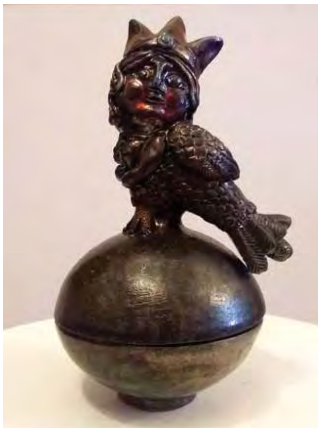
BORSÓDY Eszter: Kis-istenke (Lubok), fedeles edény Eszter BORSÓDY: Little Deity (Lubok), vessel with lid 2019, rakukerámia, 21 x Ø 10 cm