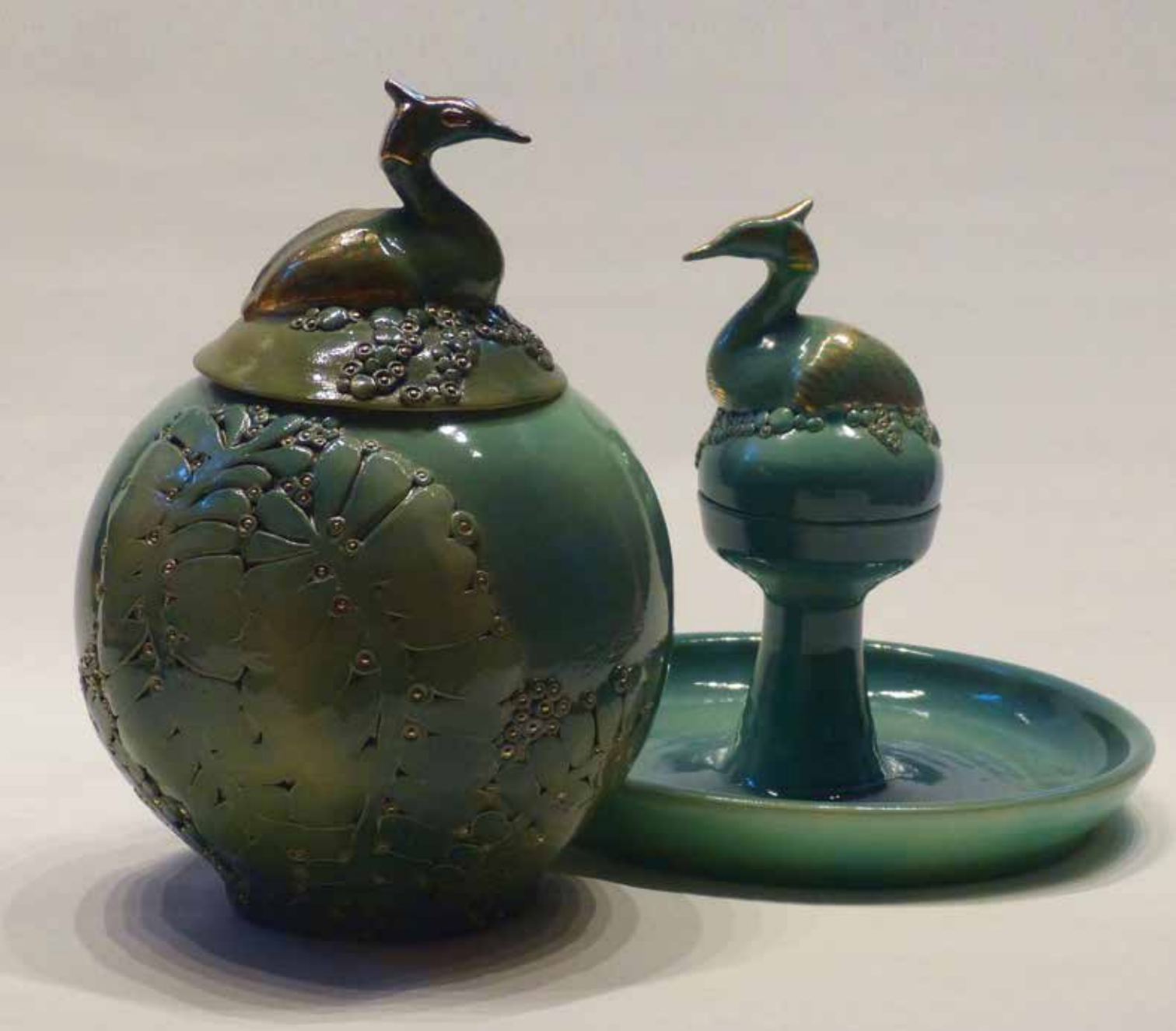
^ BORSÓDY Eszter: Édenkert I–II., kínálótál és gömb alakú fedeles edény Eszter BORSÓDY: Garden of Eden I–II, platter and spherical vessel with lid 2016, korongozott, mintázott samott, mázazott, lüszteres, 25 x Ø 19 cm és 20 x Ø 25 cm