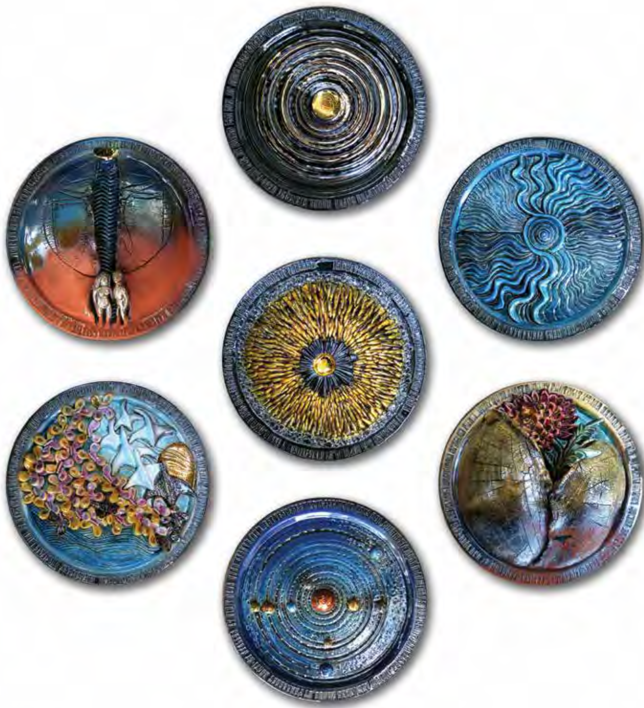
BORSÓDY Eszter: In principio – Az első 7 nap, falikép-kompozíció | Eszter BORSÓDY: In principio – The first 7 days, mural composition 2019, mintázott, repesztett samott, mázazott, lüszteres, egyenként: Ø 25 x 5 cm